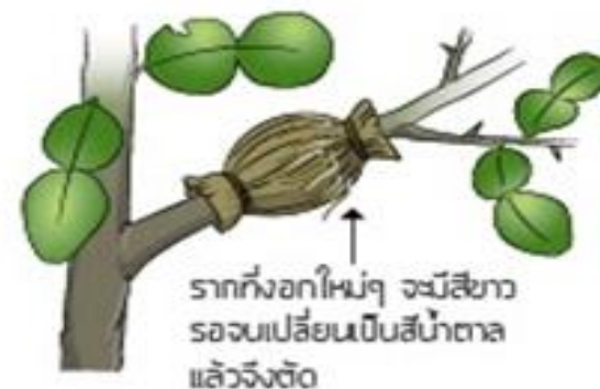
5. เมื่อรากงอก ตัดกิ่งใต้รากที่งอก