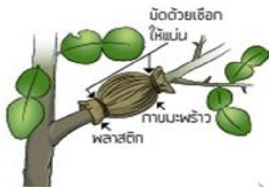
4. หุ้มด้วยกากมะพร้าวและพลาสติก