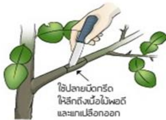
2. กรีดเปลือก