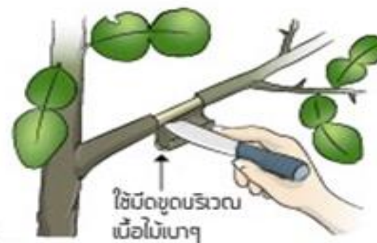
3. ชุดเนื้อไม้