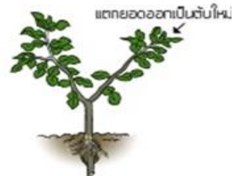
6. นำกิ่งที่ตัดมาปลูก