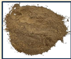
ดินเหนียว

“นักเรียนคิดว่าในหมู่บ้านแห่งนี้มีดินชนิดใดบ้าง”