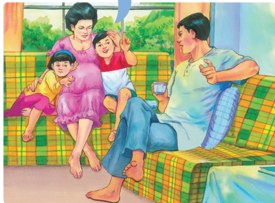
ภาพครอบครัว