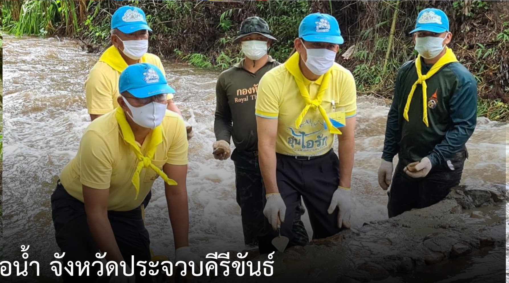
จิตอาสาพระราชทาน สร้างฝายชะลอน้ำ จังหวัดประจวบคีรีขันธ์