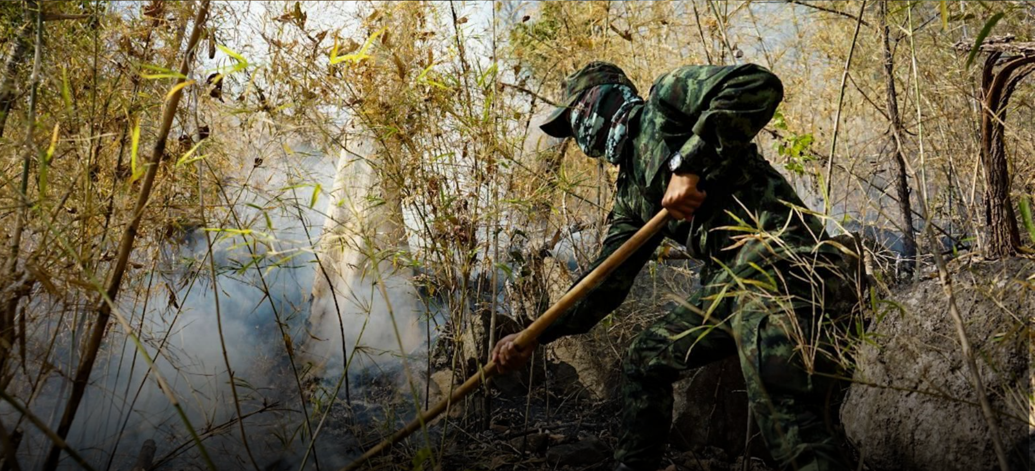
จิตอาสาพระราชทาน ร่วมกันดับไฟป่า จังหวัดขอนแก่น