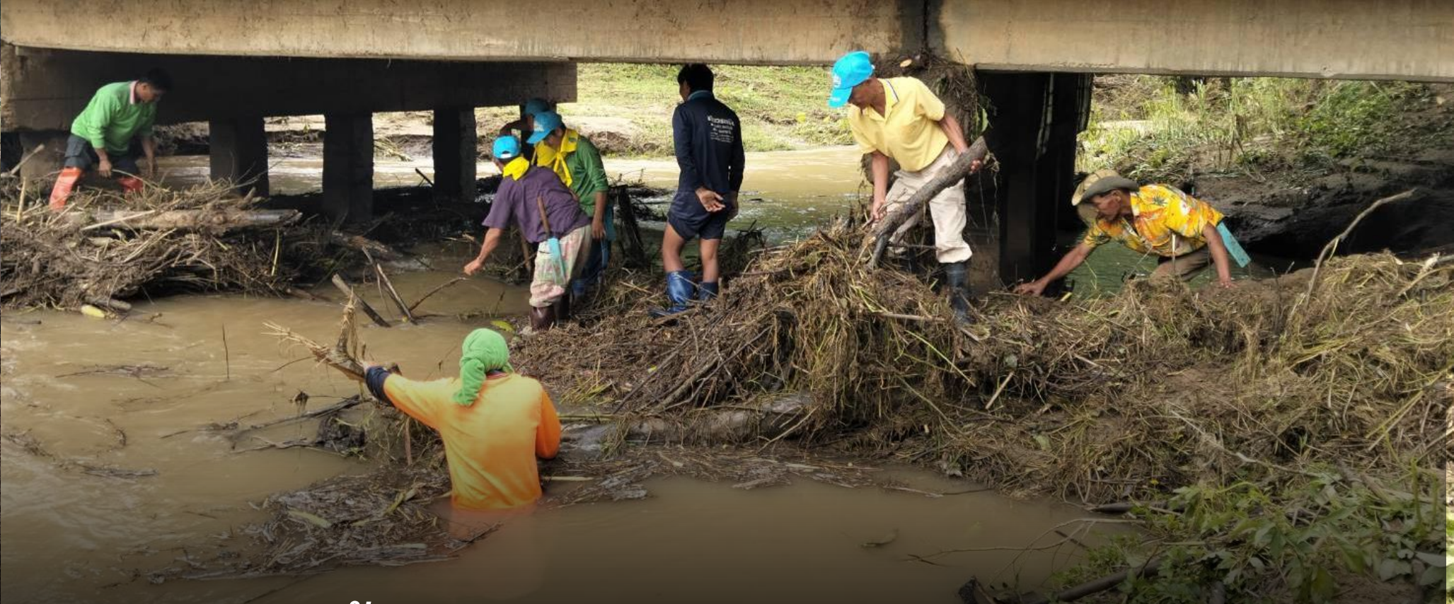
จิตอาสาพระราชทาน กำจัดวัชพืชสิ่งกีดขวางทางน้ำลำห้วย จังหวัดแม่ฮ่องสอน