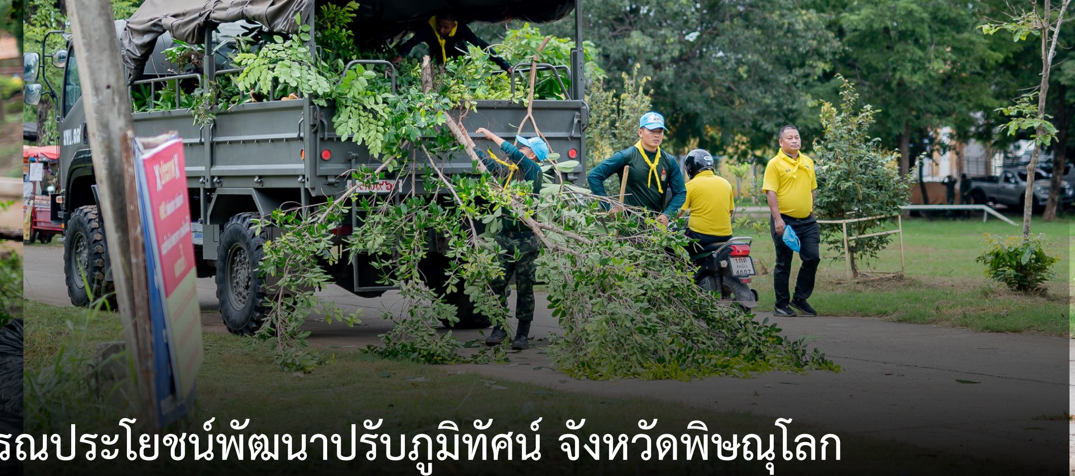
จิตอาสาพระราชทาน บำเพ็ญสาธารณประโยชน์พัฒนาปรับภูมิทัศน์ จังหวัดพิษณุโลก