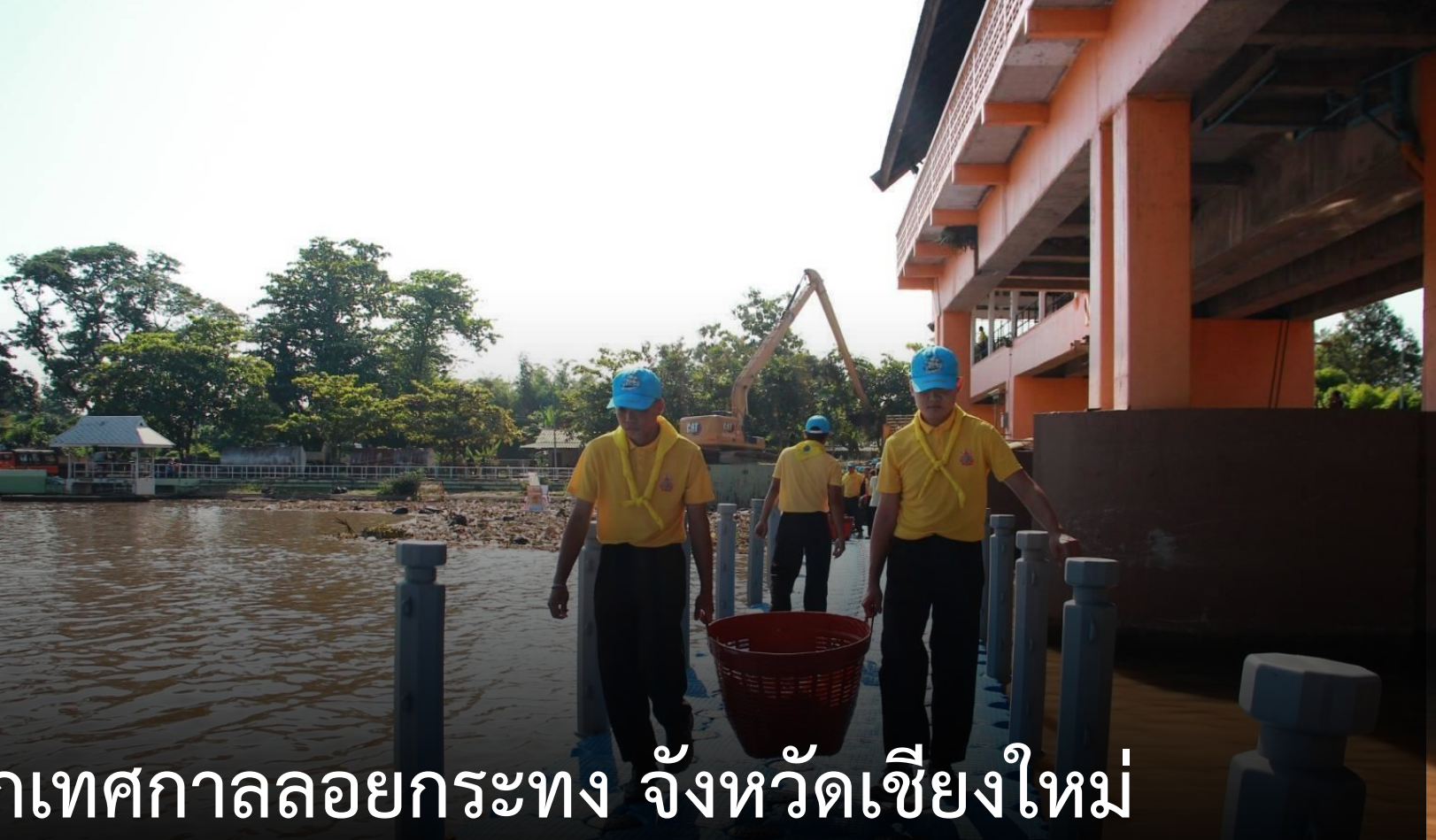
จิตอาสาพระราชทาน ทำความสะอาดแหล่งน้ำ หลังจากเทศกาลลอยกระทง จังหวัดเชียงใหม่