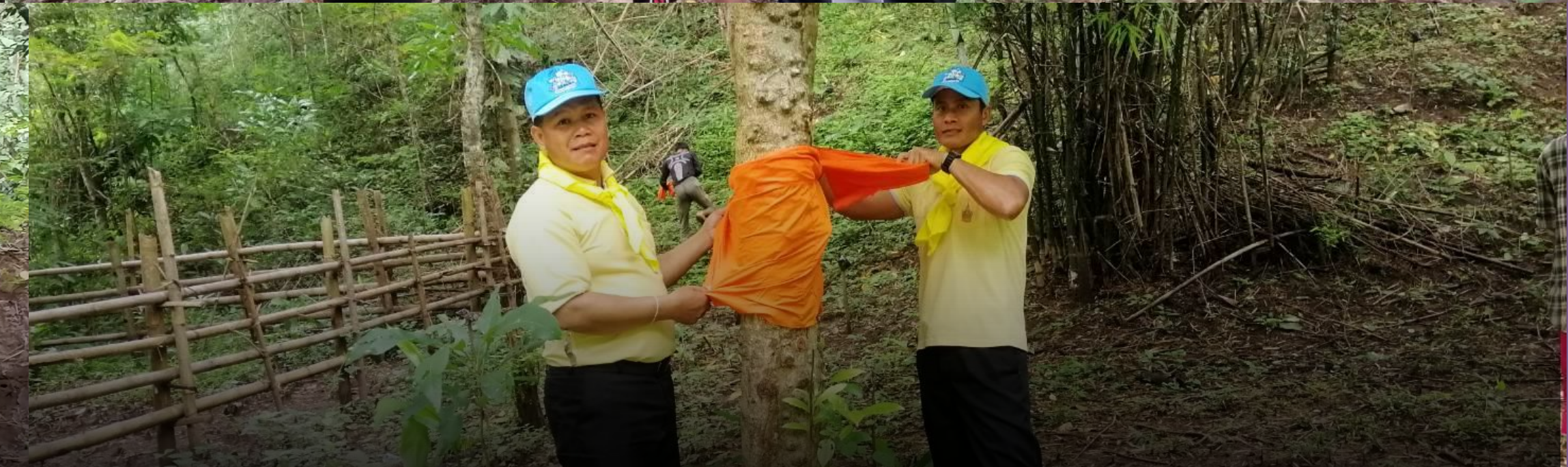
จิตอาสาพระราชทาน บวชป่า ป้องกันผืนป่าต้นน้ำ จังหวัดตาก