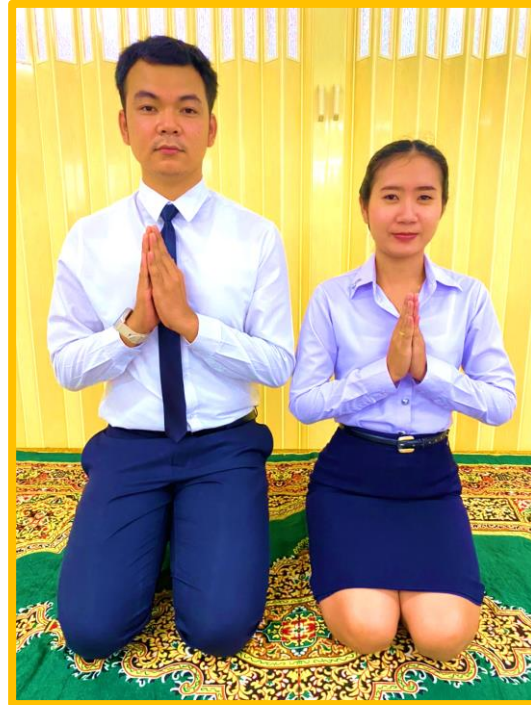
ท่ากราบ จังหวะที่ ๑ อัญชลี