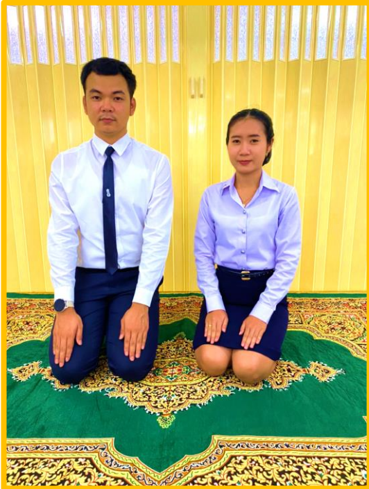
ท่าเตรียมกราบ