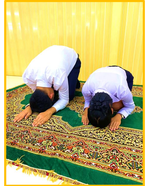
ท่ากราบ จังหวะที่ ๓ อภิวาท