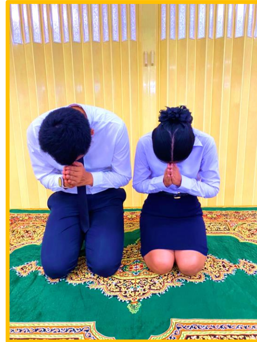
ท่ากราบ จังหวะที่ ๒ วันทา