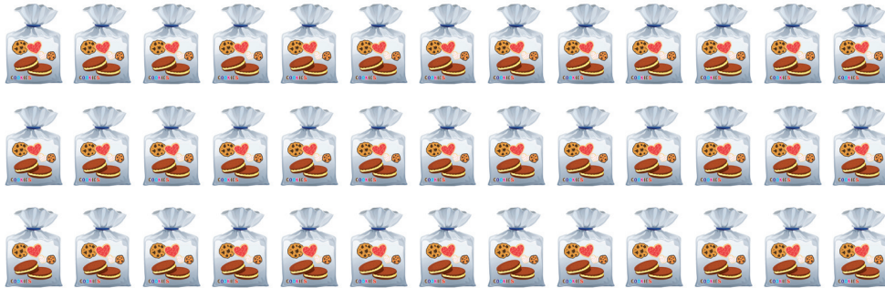
ถุงละ 5 ชิ้น