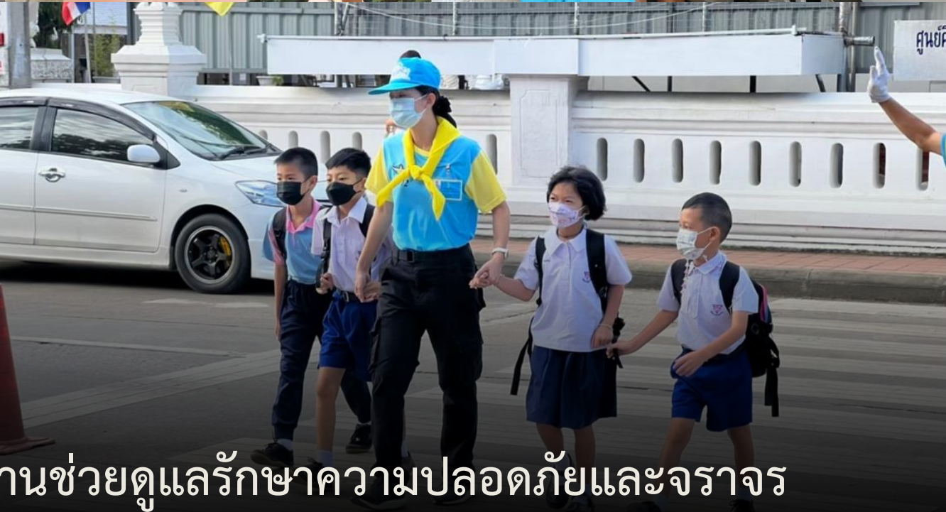
จิตอาสาพระราชทาน ลงพื้นที่ปฏิบัติงานช่วยดูแลรักษาความปลอดภัยและจราจร