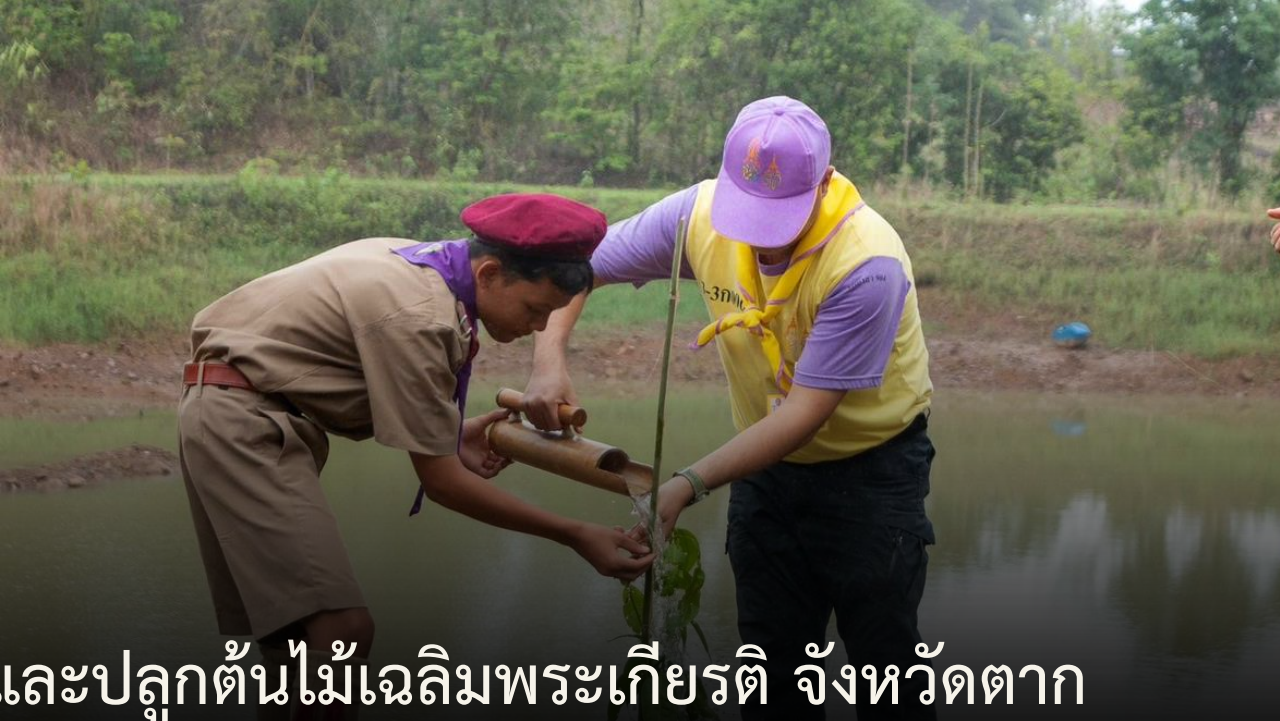
จิตอาสาพระราชทานสร้างฝายชะลอน้ำ และปลูกต้นไม้เฉลิมพระเกียรติ จังหวัดตาก