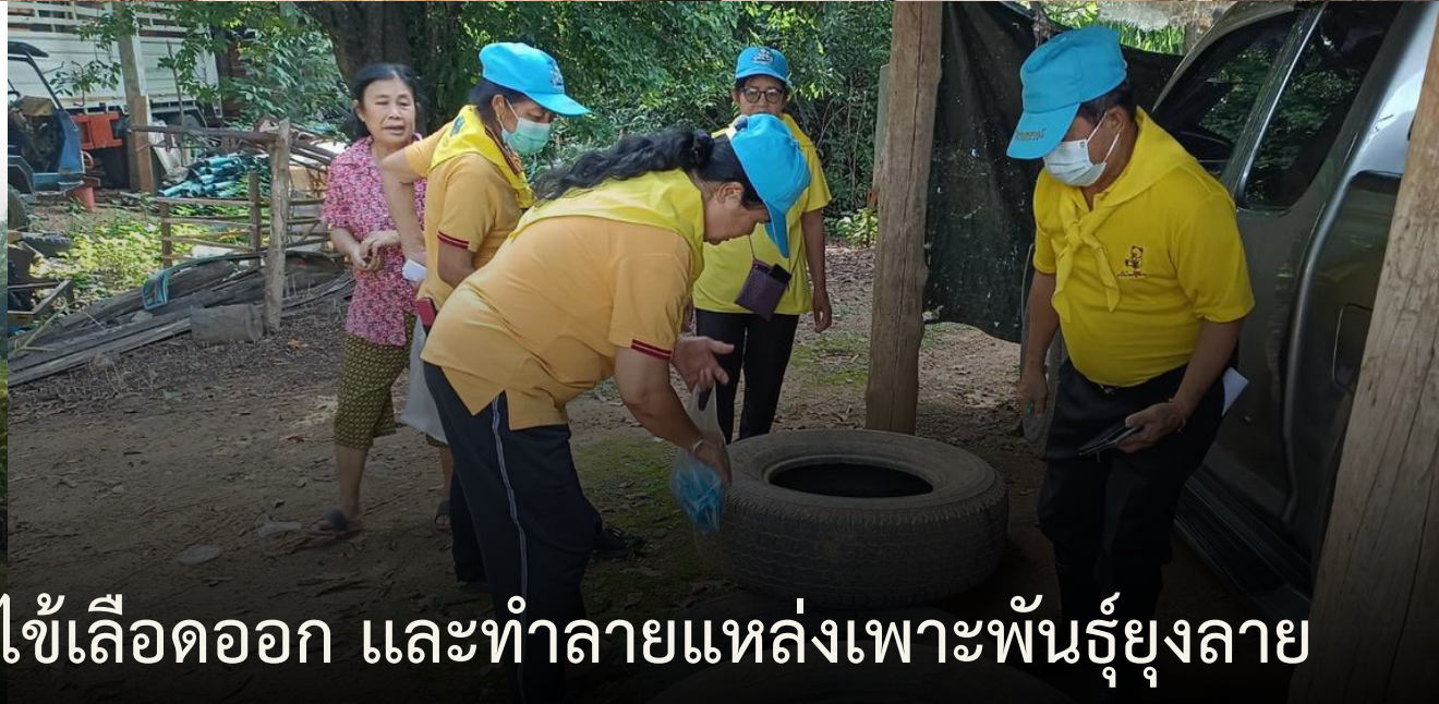
จิตอาสา ผนึกกำลังให้ความรู้การป้องกันโรคไข้เลือดออก และทำลายแหล่งเพาะพันธุ์ยุงลาย