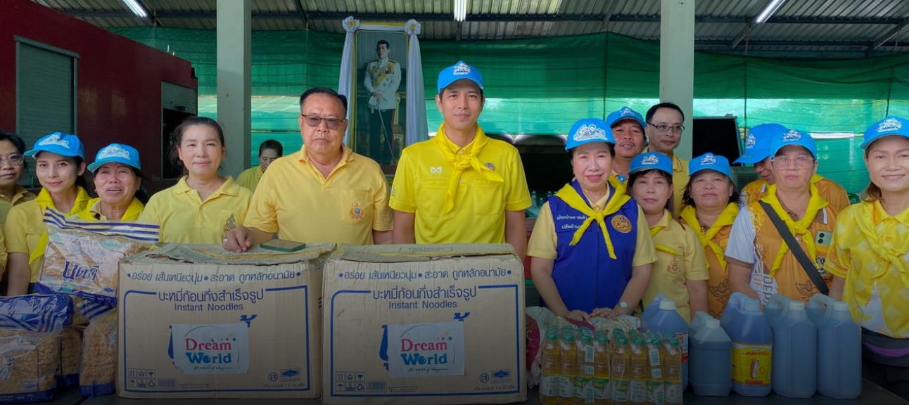
จิตอาสาจัดตั้งโรงครัวพระราชทาน เพื่อช่วยเหลือประชาชนผู้ประสบภัย จังหวัดเชียงใหม่