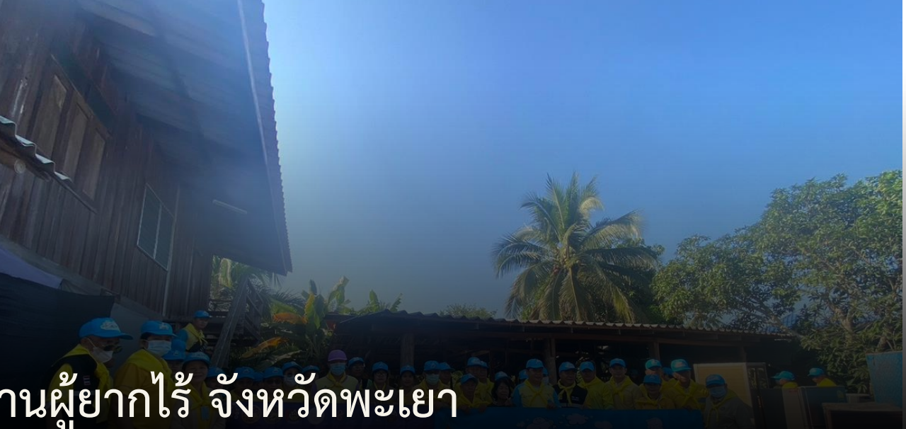
จิตอาสาพัฒนา สร้างบ้านผู้ยากไร้ จังหวัดพะเยา