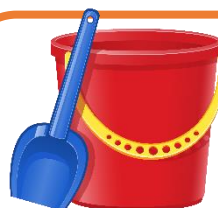
bucket and spade