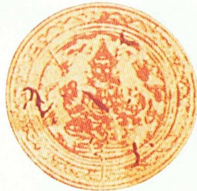
ตราบัวแก้วประจำตำแหน่ง กรมท่าโกษาธิบดี