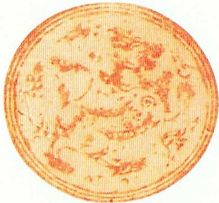
ตราพระราชสั้ท์ประจำตำแหน่ง สมุหนายก