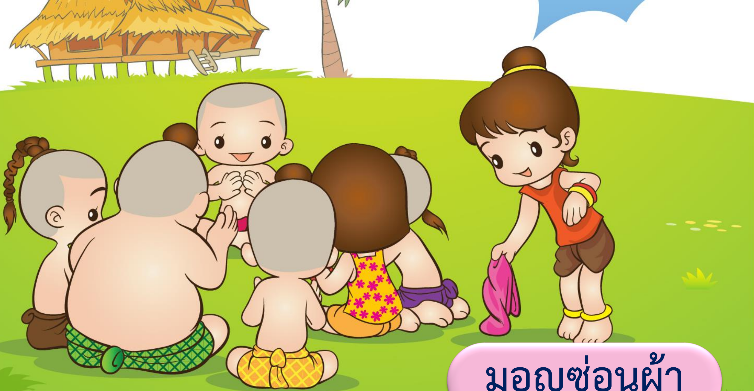
มอญช้อนผ้า