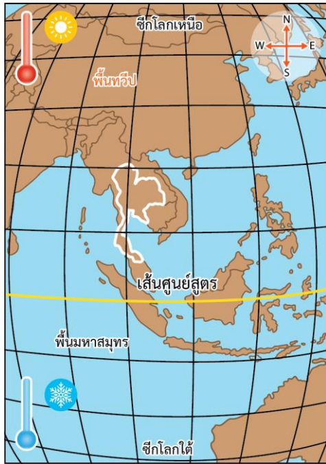
ประมาณกลางเดือนพฤษภาคม