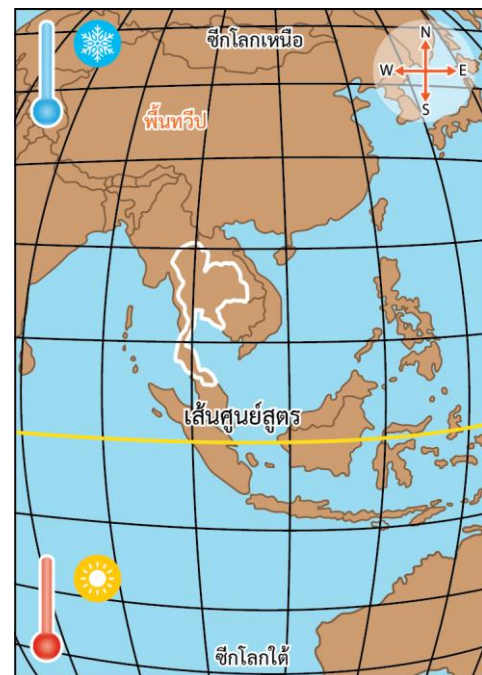
ประมาณกลางเดือนตุลาคม