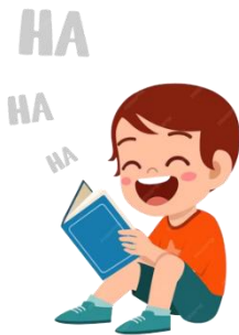
read a comic book