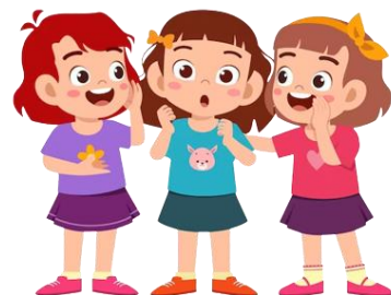
chat with friends