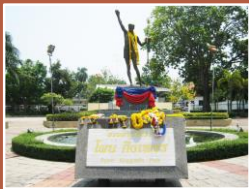
อนุสาวรีย์ไผ่น กิ่งเพชร