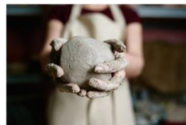
ดินเหนียว