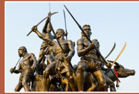
อนุสาวรีย์บางระจัน