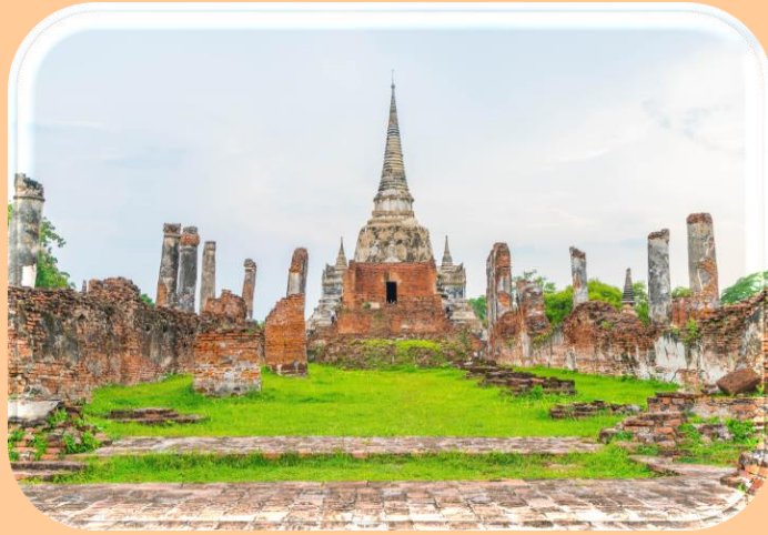
สมัยอยุธยา