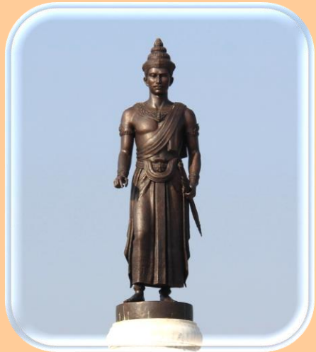
สมัยสุโขทัย