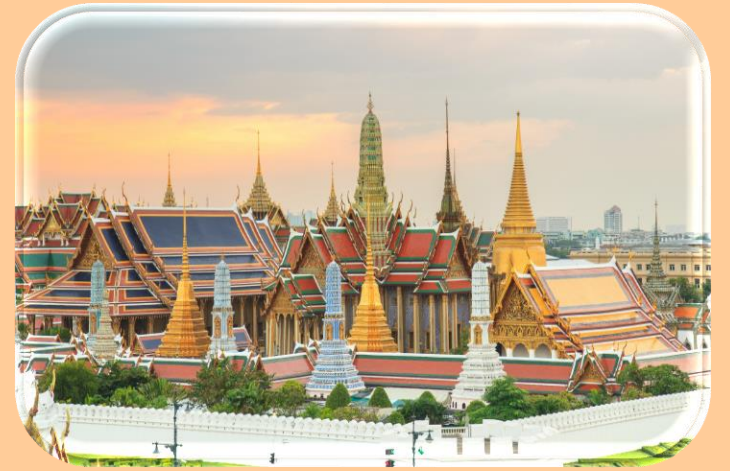
สมัยรัตนโกสินทร์