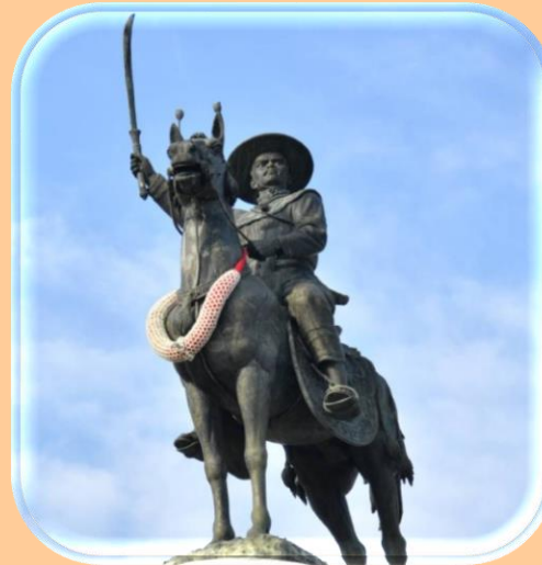
สมัยธนบุรี