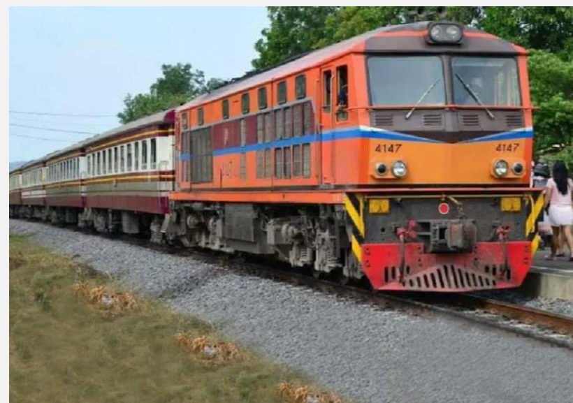
ภาพรถไฟไทย