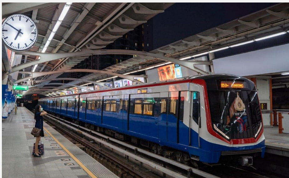
ภาพรถไฟฟ้า จากเว็บ https://www.the101.world/bts-skytrain/ สืบค้นเมื่อวันที่ 8/01/66

คำชี้แจง : ให้นักเรียนดูภาพแล้วตอบคำถามต่อไปนี้