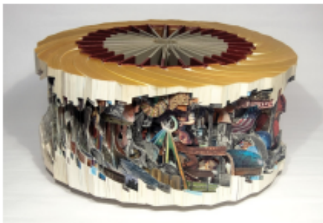
Wagnalls Wheel (2010) - Brian Dettmer

เป็นเทคนิคที่ศิลปินจะนำหนังสือเก่ามาสร้างเป็นผลงาน โดยการตัดกระดาษ ด้านในให้ออกมาเป็นผลงานที่สร้างสรรค์ สื่อผสมประเภทนี้อาจมีความเรียบง่าย หรือซับซ้อนราวกับเป็นประติมากรรม เช่น ภาพสามมิติของสัตว์ คน สิ่งของ ส่วนใหญ่จะเลือกงานศิลปะโบราณหรือวิคตอเรีย เป็นเพราะง่ายต่อการหลีกเลี่ยงปัญหาลิขสิทธิ์ สามารถพบเห็นได้ในหอศิลป์ หรือซื้อได้จากอินเทอร์เน็ต