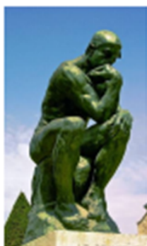
ประติมากรรม