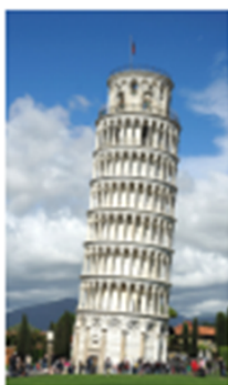
สถาปัตยกรรม