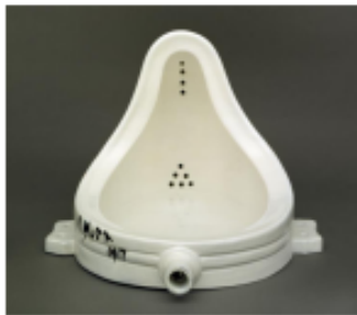
Fountain (1917) - Marcel Duchamp

เป็นการนำวัสดุที่ถูกทำขึ้นเพื่อประโยชน์ใช้สอยอื่น ๆ หรือวัสดุเหลือใช้ที่ไม่มีประโยชน์ในการใช้สอยแล้วมาสร้างเป็นเรื่องราวใหม่ ให้กลายเป็นผลงานศิลปะ โดยผ่านการปรุงแต่งน้อยที่สุด ศิลปะสื่อผสมประเภทนี้ได้รับแนวคิดมาจากศิลปิน Marcel Duchamp ที่ได้นำเอาโถสุขภัณฑ์ มาสร้างสรรค์และตีความใหม่ให้กลายเป็นงานศิลปะ อีกตัวอย่างงานศิลปะที่มีชื่อเสียงที่สร้างในรูปแบบวัสดุสำเร็จรูปคือ ผลงาน Lobster Telephone ของศิลปิน Salvador Dalí ที่เป็นผลงานในลัทธิเหนือจริง (Surrealism) ศิลปินได้นำเอาวัตถุที่ไม่มีความเชื่อมโยงกันมาประกอบกันและสร้างความหมายขึ้นใหม่