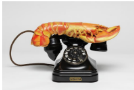
Lobster Telephone (1938) - Salvador Dalí