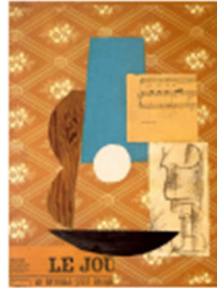
Guitar, Sheet Music and Glass (1912) - Pablo Picasso

เป็นรูปแบบศิลปะที่เกี่ยวกับการนำวัสดุต่าง ๆ มาสร้างสรรค์เป็นผลงานศิลปะ เช่น ารบิ้น คลิป หนังสือพิมพ์ ภาพถ่าย เพื่อนำมาใช้สร้างสิ่งใหม่ ภาพปะติดนี้มาตั้งแต่สมัยโบราณ แต่เป็นที่นิยมและใช้กันอย่างแพร่หลายในปี ค.ศ.1912 เมื่อกลุ่มศิลปินลัทธิคิวบิสม์ (Cubism) ในยุโรป นำโดยปิกัสโซ (Pablo Picasso) และจอร์จ บราก (Georges Braque) ได้นำวัสดุต่าง ๆ เช่น ผ้า