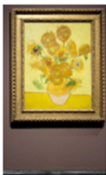
จิตรกรรม

งานทัศนศิลป์เป็นงานที่มีรูปแบบเฉพาะตัว เพื่อให้ผู้ชมสามารถรับรู้ความหมายของงานที่สร้างขึ้น ถ่ายทอดเรื่องราวหรือเหตุการณ์ต่าง ๆ ในรูปแบบสองมิติหรือสามมิติ โดยงานทัศนศิลป์แบ่งออกเป็น 5 ประเภท ได้แก่ จิตรกรรม ประติมากรรม สถาปัตยกรรม ภาพพิมพ์ และสื่อผสม