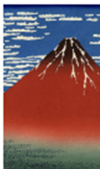
ภาพพิมพ์