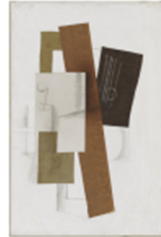
Guitar (1913) - Georges Braque

กระดาษ มาปะติดรวมกันกับภาพวาด และเรียกวิธีการนี้ว่า "คอลลาจ" (Collage) มีลักษณะเป็น สองมิติ