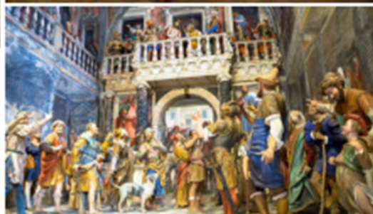
ภาพชุดชีวิตของนักบุญฟรานซิสแห่งอาซิซิในซาเปา (St. Francis of Assisi Chapel) ค.ศ.1583 ที่ภูเขาศักดิ์สิทธิ์แห่งพิดมอนด์และลอมบาร์ดี (Sacri Monti of Piedmont and Lombardy)