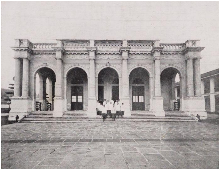
หอพระสมุทวชิรญาณ (อ้างอิง : กรมศิลปากร)

วรรณกรรมในสมัยนี้มีลักษณะ สอดคล้องกับนโยบายการพัฒนา บ้านเมืองให้ทันสมัย เริ่มมีงานประพันธ์ ด้านร้อยแก้ว การจัดตั้งโรงพิมพ์หลวง เป็นผลทำให้วรรณกรรมทั้งเก่าและใหม่ แพร่ขยายไปสู่ประชาชนอย่างมากนับแต่ สมัยรัชกาลที่ ๕ ประกอบกับทางการมี นโยบายส่งเสริมการศึกษาในรูปแบบใหม่ แก่ประชาชน จึงทำให้มีการนำวิทยาการ ต่าง ๆ ของตะวันตกมาผสมผสานกับการ ประพันธ์ของไทย มีการจัดตั้งหอสมุด สำหรับพระนคร “หอพระสมุทวชิรญาณ” รวบรวมเอกสารสำคัญของชาติ มีผลงาน ที่สำคัญของ พระบาทสมเด็จพระจอม