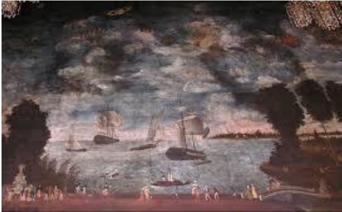
ผลงานจิตรกรรมฝาผนังโดย ชรวอินโข่ง

(อ้างอิง : วารสารวิจิตรศิลป์ ปีที่ ๑๐ ฉบับที่ ๑)