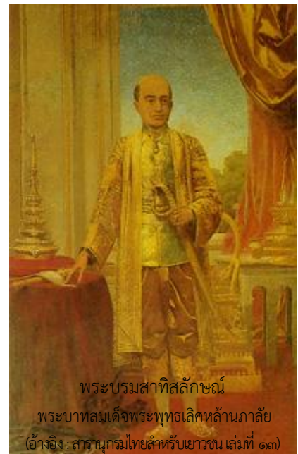
พระบรมสาทิสลักษณ์

ในสมัยรัชกาลที่ ๕ มีการวาดภาพพระราชประวัติเขียนแบบจิตรกรรมประเพณีผสมกับทางตะวันตกและภาพเหมือนบุคคลไว้ที่ผนังพระที่นั่งทรงผนวช (ปัจจุบันอยู่ที่วัดเบญจมบพิตร) นอกจากนี้ รัชกาลที่ ๕ โปรดเกล้า ฯ ให้จิตรกรชาวยุโรปวาดพระบรมสาทิสลักษณ์พระมหากษัตริย์แห่งราชวงศ์จักรีทุกพระองค์ และพระบรมวงศานุวงศ์ที่สำคัญในรัชสมัยของพระองค์ ทั้งฝ่ายหน้าและฝ่ายใน ใส่กรอบประดิษฐานที่พระที่นั่งจักรีมหาปราสาทและพระที่นั่งในพระราชวังต่าง ๆ การวาดภาพเหมือนและภาพทิวทัศน์ได้รับความนิยมแพร่หลาย