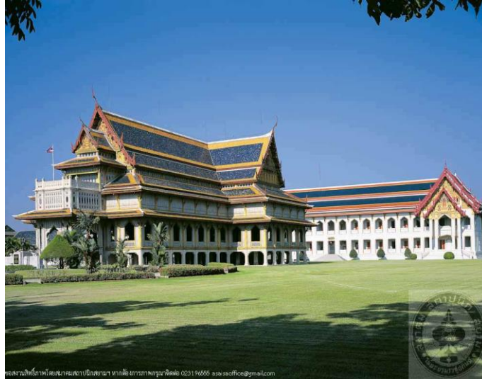
โรงเรียนวชิราวุธวิทยาลัย

ดังจะเห็นได้จากการสร้างอาคารในโรงเรียนมหาดเล็กหลวง ซึ่งปัจจุบันคือ โรงเรียนวชิราวุธวิทยาลัย และ ตึกบัญชาการ โรงเรียนข้าราชการพลเรือนของ พระบาทสมเด็จพระจุลจอมเกล้าเจ้าอยู่หัว ปัจจุบันคือ อาคารมหาจุฬาลงกรณ์ จุฬาลงกรณ์มหาวิทยาลัย