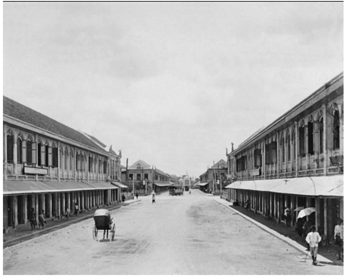
ถนนเจริญกรุง พ.ศ. ๒๔๐๗

เป็นที่ประทับของสมเด็จพระศรีพัชริน ทราบรมราชินีนาถ พระบรมราชชนนีพัน ปีหลวง กลุ่มอาคารในโรงพยาบาล จุฬาลงกรณ์ บ้านนรสิงห์ ที่สร้างขึ้นเพื่อ พระราชทานแก่เจ้าพระยารามราฆพ (หม่อมหลวงเพื่อ ฟังบุญ) และบ้านบรม สินธุ์ เพื่อพระราชทานแก่ พระยาอนิรุทธิ์เท วา (หม่อมหลวงฟื้น ฟังบุญ) รูปแบบ สถาปัตยกรรมซึ่งแตกต่างจากยุคสมัยที่ ผ่านมา และนับเป็นรูปแบบตามพระราช นิยมในพระบาทสมเด็จพระมงกุฎเกล้า เจ้าอยู่หัว คือ การประยุกต์แบบจารีตเข้า กับพื้นที่ใช้สอยแบบอาคารตะวันตก