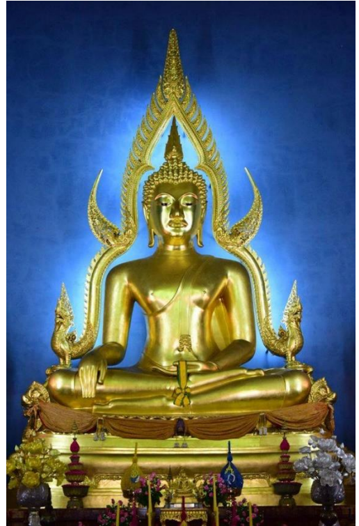
พระพุทธชินราช (จำลอง) วัดเบญจมบพิตร

สมัยรัชกาลที่ ๔ ถึงรัชกาลที่ ๕ เป็นยุคสมัยของการปรับตัว เปิดประเทศ ยอมรับอิทธิพลตะวันตก ยอมรับความคิดใหม่มาเปลี่ยนแปลงสังคม ระเบียบประเพณี เพื่อประคองให้ประเทศรอดพ้นจากภัยสงคราม หรือจากลัทธิล่าอาณานิคมตะวันตก ซึ่งหลายประเทศในซีกโลกเอเชียยุคนั้นประสบอยู่ การสร้างงานศิลปกรรมทุกสาขา รวมทั้งประติมากรรม ก็ถูกกระแสนี้ด้วย ในสมัยตั้งแต่รัชกาลที่ ๔ มีการเริ่มสร้างพระพุทธรูปให้มีพุทธลักษณะแบบมนุษย์ ตามรูปแบบที่ตะวันตกนิยม รวมทั้งให้มีการหล่อพระรูปเหมือนของพระมหากษัตริย์ ต่อมาในสมัยรัชกาลที่ ๕ อายุกรุงรัตนโกสินทร์จะครบ ๑๐๐ ปี พระบาทสมเด็จพระจุลจอมเกล้าเจ้าอยู่หัวทรงทำนุบำรุงศิลปแบบดั้งเดิมอย่างมาก มีการปฏิสังขรณ์วัดวาอารามต่าง ๆ ปราสาทราชมนเฑียร โดยเฉพาะวัดพระศรีรัตนศาสดาราม เกิดงานประติมากรรมตกแต่งที่สวยงามในศาสนสถานแห่งนี้มากที่สุด ทรงโปรดเกล้าฯ ให้ช่างไทยหล่อพระราชลัญจกรประจำรัชกาลที่ ๑-๕ รวมถึงรูปช้างเผือกและสัตว์ป่าสำคัญในป่าหิมพานต์ ประดิษฐานที่