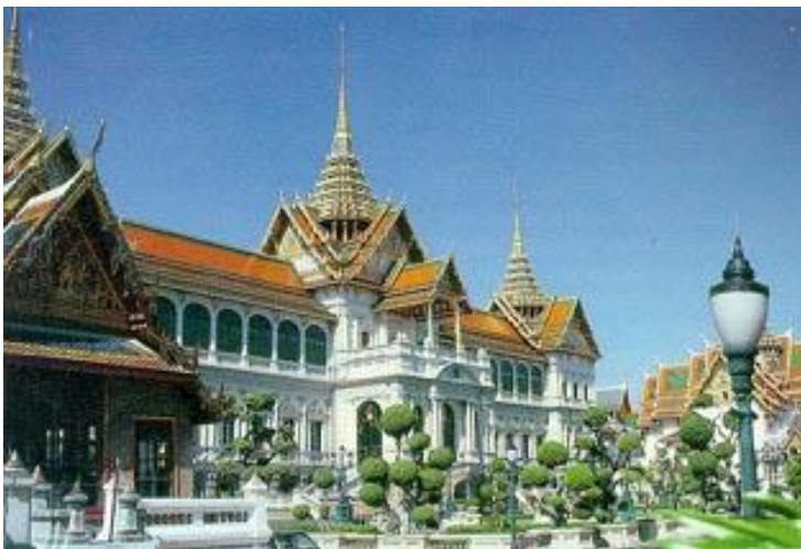
พระที่นั่งจักรีมหาปราสาท พระบรมมหาราชวัง (อ้างอิง : สารานุกรมไทยสำหรับเยาวชน เล่มที่ ๒)

ธรรมประวัติ พระที่นั่งวโรภาสพิมาน ที่พระราชวังบางปะอิน รวมถึงสถานที่ราชการ เช่น กระทรวงกลาโหม ในสมัยรัชกาลที่ ๕ เรือนไทยเริ่มปรับปรุงรูปทรงแบบยุโรป เป็นเรือนไม้ ๒ ชั้น มีฝาดผนังปิดมิดชิด หลังคาทรงปั้นหยา ทรงมนิลา มุงด้วยกระเบื้องว่าว ชายติดไม้ฉลุลาย (ลายขนมปังขิง) ตัวอย่างเรือนไม้ประยุกต์ ที่งดงามคือ พระที่นั่งวิมานเมฆ และพระที่นั่งอภิเชษฐาสวรรค์ ภายในพระราชวังดุสิต ในสมัยรัชกาลที่ ๖ ก็ยังคง นิยมสร้างพระราชวังในลักษณะเดียวกัน นอกจากตำหนักในพระราชวังสนามจันทร์ พระบาทสมเด็จพระมงกุฎ เกล้าเจ้าอยู่หัวยังทรงโปรดฯ ให้สร้างอาคารแบบสถาปัตยกรรมตะวันตกหลายแห่ง เช่น พระราชวังพญาไทเพื่อ