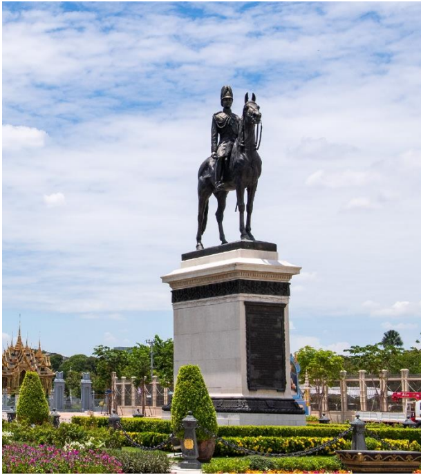
พระบรมรูปทรงม้า

(อ้างอิง : สำนักการวางผังและพัฒนาเมือง กรุงเทพมหานคร)