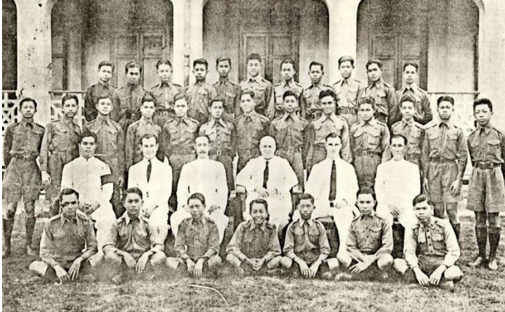
คณะครูและนักเรียนโรงเรียนสวนกุหลาบวิทยาลัย (อ้างอิง : พพิธภัณฑ์การศึกษาไทย โรงเรียนสวนกุหลาบวิทยาลัย )

ในสมัยพระบาทสมเด็จพระจุลจอมเกล้าเจ้าอยู่หัวพระองค์ทรงเล็งเห็นความสำคัญของการศึกษาว่าเป็นส่วนสำคัญในการปรับปรุงประเทศให้ทันสมัยตามแบบตะวันตกจึงโปรดเกล้าให้ปฏิรูปการศึกษาด้วยสาเหตุต่อไปนี้