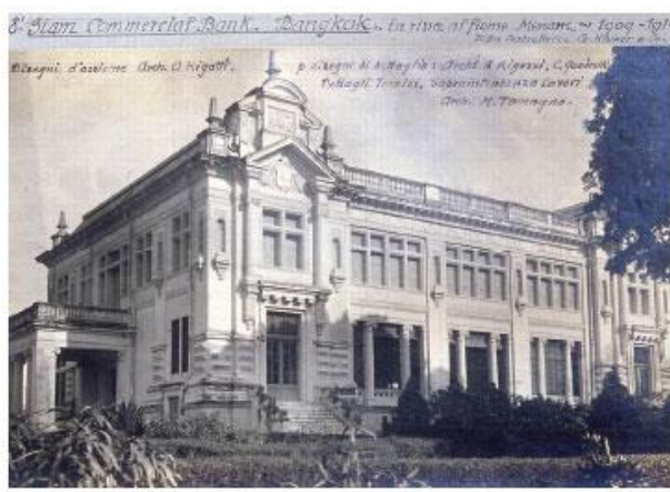
แบงก์สยามกัมมาจล สำนักงานตลาดน้อย

กิจการธนาคารในระยะแรกเป็นของชาวต่างประเทศสำหรับธนาคารแห่งแรกของชาวไทยนั้น เริ่มต้นขึ้นเมื่อ พ.ศ. ๒๔๔๗ เรียกชื่อว่า “บुकคัลภย์” และได้ขยายกิจการเปลี่ยนชื่อเป็น “แบงก์สยามกัมมาจล ทุนจำกัด” ต่อมาจึงได้เปลี่ยนชื่อเป็น “ธนาคารไทยพาณิชย์ จำกัด” ซึ่งดำเนินการมาจนถึงปัจจุบันส่วนธนาคารของรัฐบาลคือ ธนาคารออมสิน จัดตั้งขึ้นในสมัยพระบาทสมเด็จพระมงกุฎเกล้าเจ้าอยู่หัว