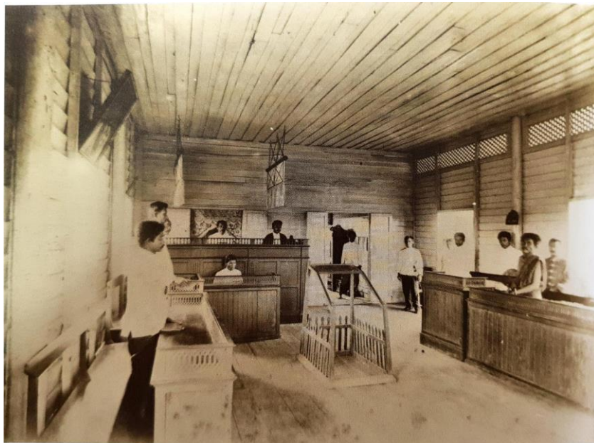
การพิจารณาคดีในสมัยรัชกาลที่ ๕

(อ้างอิง : หนังสือ ประมวลภาพประวัติศาสตร์ไทย: วิถีชีวิต โดย สำนักหอจดหมายเหตุแห่งชาติ)