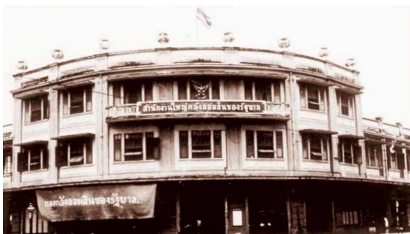
ธนาคารออมสิน

(อ้างอิง : หนังสือ ใต้ร่มพระบารมี ๒๓๗ ปี กรุงรัตนโกสินทร์ โดย กระทรวงวัฒนธรรม)