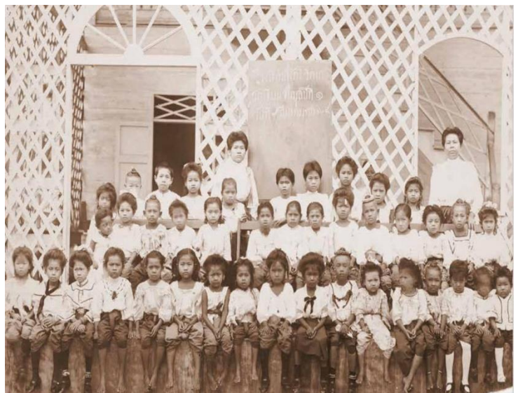
คณะครูและนักเรียนโรงเรียนสตรีวิทยา (อ้างอิง : หนังสือ ไตรัมพระบารมี ๒๓๗ ปี กรุงรัตนโกสินทร์ โดย กระทรวงวัฒนธรรม)

๔. การขาดแคลนข้าราชการในกระทรวง กรม กองที่จัดตั้งขึ้นใหม่ตามแบบตะวันตก จึงมีการก่อสร้างโรงเรียนสำหรับราษฎรขึ้นแห่งแรกเมื่อ พ.ศ. ๒๔๒๘ ชื่อ “โรงเรียนวัดมทรณพาราม” และโรงเรียนที่ตั้งขึ้นตามวัดอีกหลายแห่ง มีการยกระดับการศึกษาของกุลสตรี ก่อตั้งโรงเรียนสำหรับสตรี ต่อมาจะมีการพัฒนาปรับเปลี่ยนการเรียนการสอนเพื่อสร้างบุคลากรเข้ารับราชการพลเรือนใน พ.ศ. ๒๔๓๐ จัดตั้งกรมศึกษาธิการขึ้นต่อมาเป็นกรมธรรมการ และยกฐานะของกรมธรรมการ ขึ้นเป็น “กระทรวงธรรมการ” หรือ “กระทรวงศึกษาธิการ” ในปัจจุบัน