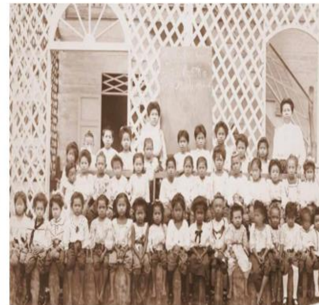
คณะครูและนักเรียนโรงเรียนสตรีวิทยา

๔. การขาดแคลนข้าราชการในกระทรวง กรม กองที่จัดตั้งขึ้นใหม่ตามแบบตะวันตก จึงมีการก่อสร้างโรงเรียนสำหรับราษฎรขึ้นแห่งแรกเมื่อ พ.ศ. ๒๔๒๘ ชื่อ “โรงเรียนวัดมเหยงคณ์พาราม” และโรงเรียนที่ตั้งขึ้นตามวัดอีกหลายแห่ง มีการยกระดับการศึกษาของกุลสตรีก่อตั้งโรงเรียนสำหรับสตรี ต่อมาจะมีการพัฒนาปรับเปลี่ยนการเรียนการสอนเพื่อสร้างบุคลากรเข้ารับราชการพลเรือนใน พ.ศ. ๒๔๓๐ จัดตั้งกรมศึกษาธิการขึ้นต่อมาเป็นกรมธรรมการ และยกฐานะของกรมธรรมการ ขึ้นเป็น “กระทรวงธรรมการ” หรือ “กระทรวงศึกษาธิการ” ในปัจจุบัน