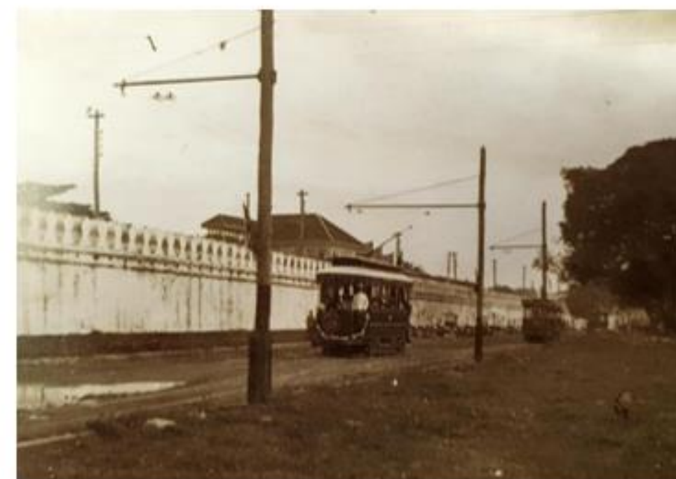
การเดินรถรางในสมัยรัชกาลที่ ๖

กิจการเดินรถรางได้เริ่มต้นขึ้นในสมัยรัชกาลที่ ๕ เมื่อ พ.ศ. ๒๔๓๐ โดยชาวเดนมาร์กเป็นผู้รับสัมปทานในการสร้างใน พ.ศ. ๒๔๓๑ ได้เปิดบริการรถรางสายหลักเมืองถนนตกเป็นครั้งแรก