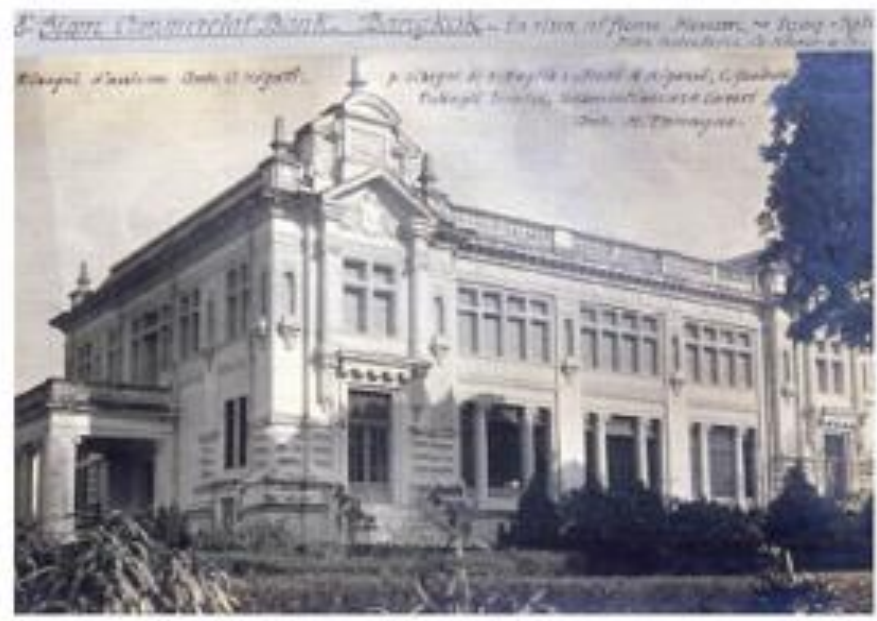
แบงก์สยามกัมมาจล สำนักงานตลาดน้อย (อ้างอิง : มุลินีสยามกัมมาจล )

กิจการธนาคารในระยะแรกเป็นของชาวต่างประเทศสำหรับธนาคารแห่งแรกของชาวไทยนั้น เริ่มต้นขึ้นเมื่อ พ.ศ. ๒๔๔๗ เรียกชื่อว่า “บุคคลิภัย” และได้ขยายกิจการเปลี่ยนชื่อเป็น “ แบงก์สยามกัมมาจล ทุนจำกัด ” ต่อมาจึงได้เปลี่ยนชื่อเป็น “ธนาคารไทยพาณิชย์ จำกัด” ซึ่งดำเนินการมาจนถึงปัจจุบันส่วนธนาคารของรัฐบาลคือ ธนาคารออมสิน จัดตั้งขึ้นในสมัยพระบาทสมเด็จพระมงกุฎเกล้าเจ้าอยู่หัว