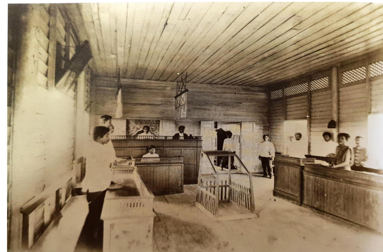
การพิจารณาคดีในสมัยรัชกาลที่ ๕ (อ้างอิง : หนังสือ ประมวลภาพประวัติศาสตร์ไทย:วิถีชีวิต