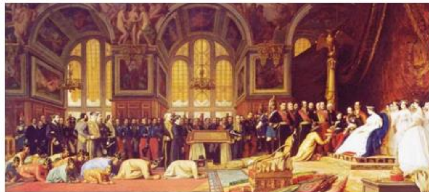
คณะราชทูตสยามเข้าเฝ้าจักรพรรดินโปเลียนที่ ๓

ณ พระราชวังฟงแตนโบล วันที่ ๒๗ มิถุนายน พ.ศ. ๒๔๐๔