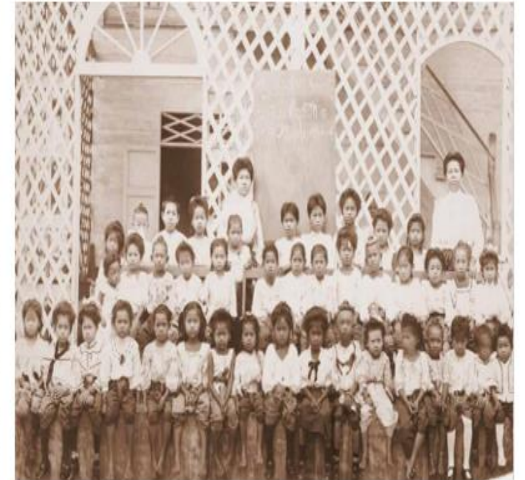
คณะครูและนักเรียนโรงเรียนสตรีวิทยา (อ้างอิง : หนังสือ ได้รมพระบารมี ๒๓๗ ปี กรุงรัตนโกสินทร์ โดย กระทรวงวัฒนธรรม)

๔. การขาดแคลนข้าราชการในกระทรวง กรม กองที่จัดตั้งขึ้นใหม่ตามแบบตะวันตก จึงมีการก่อสร้างโรงเรียนสำหรับราษฎรขึ้นแห่งแรกเมื่อ พ.ศ. ๒๔๒๘ ชื่อ “โรงเรียนวัดมเหยงคณ์พาราม” และโรงเรียนที่ตั้งขึ้นตามวัดอีกหลายแห่ง มีการยกระดับการศึกษาของกุลสตรีก่อตั้งโรงเรียนสำหรับสตรี ต่อมาจะมีการพัฒนาปรับเปลี่ยนการเรียนการสอนเพื่อสร้างบุคลากรเข้ารับราชการพลเรือนใน พ.ศ. ๒๔๓๐ จัดตั้งกรมศึกษาธิการขึ้นต่อมาเป็นกรมธรรมการ และยกฐานะของกรมธรรมการ ขึ้นเป็น “กระทรวงธรรมการ” หรือ “กระทรวงศึกษาธิการ” ในปัจจุบัน