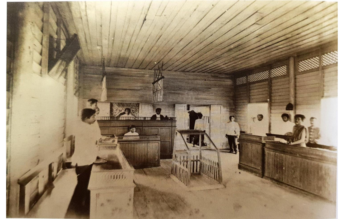
การพิจารณาคดีในสมัยรัชกาลที่ ๕ (อ้างอิง : หนังสือ ประมวลภาพประวัติศาสตร์ไทย:วิถีชีวิต