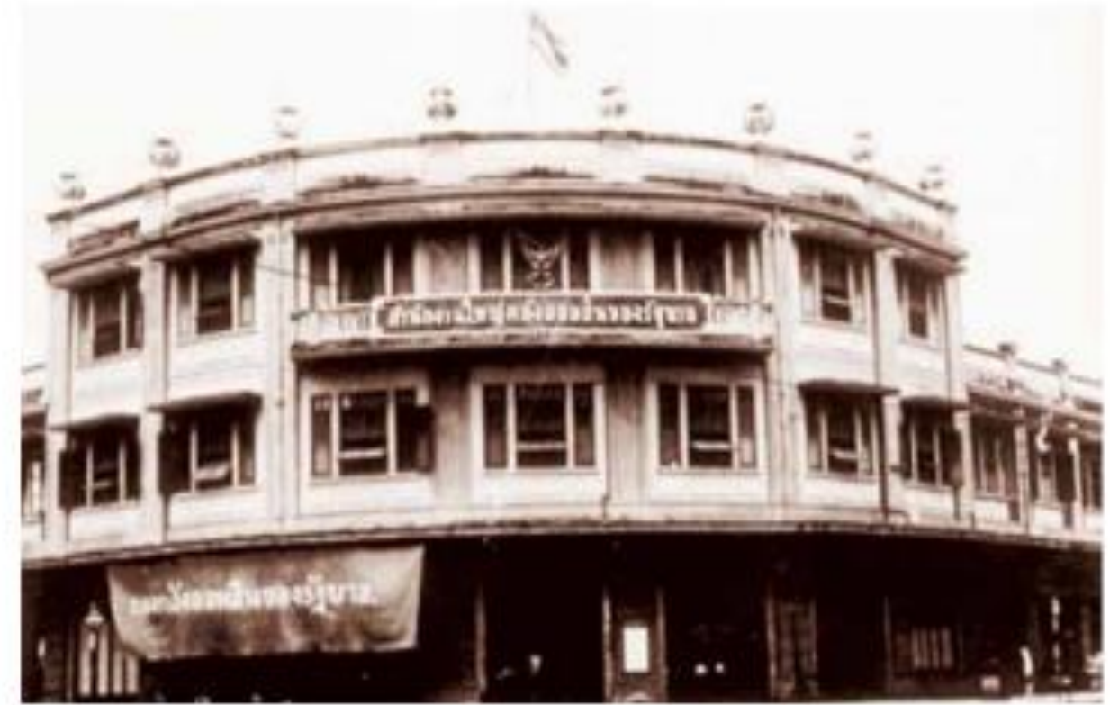
ธนาคารออมสิน

(อ้างอิง : หนังสือ ได้ร่มพระบารมี ๒๓๗ ปี กรุงรัตนโกสินทร์ โดย กรมหลวงวัฒนธรรม)