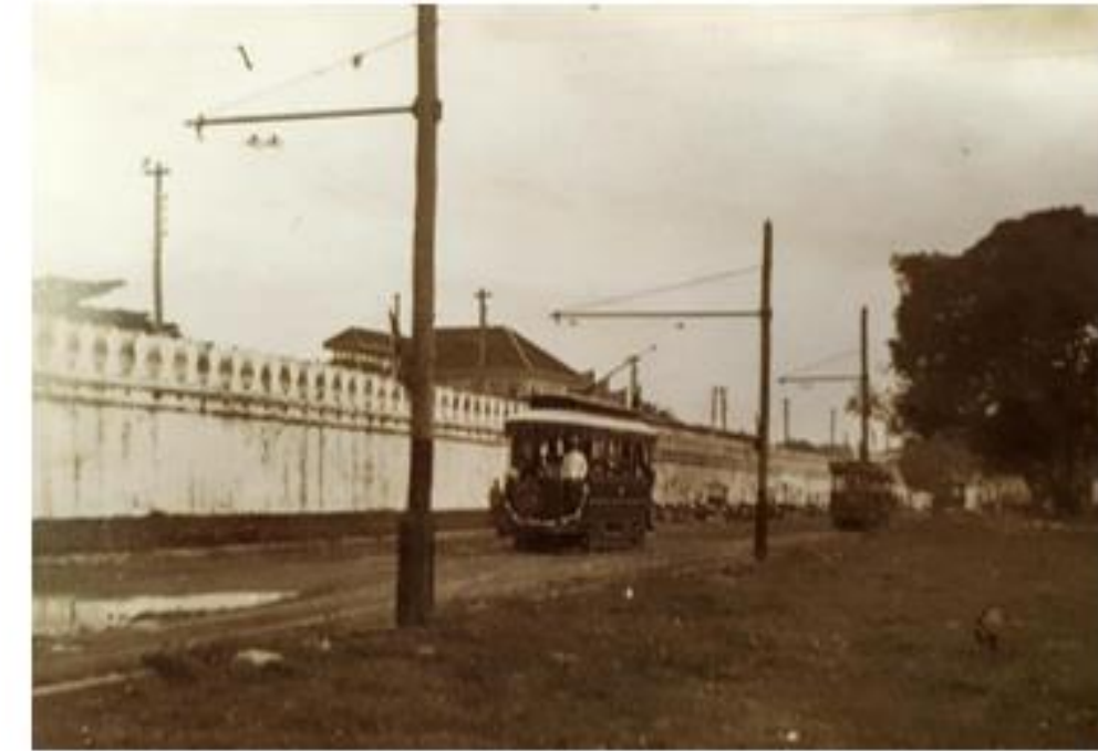
การเดินรถรางในสมัยรัชกาลที่ ๖ (อ้างอิง : หนังสือ ประมวลภาพประวัติศาสตร์ไทย: วิถีชีวิต โดย สำนักหอจดหมายเหตุแห่งชาติ)

กิจการเดินรถรางได้เริ่มต้นขึ้นในสมัยรัชกาลที่ ๕ เมื่อ พ.ศ. ๒๔๓๐ โดยชาวเดนมาร์กเป็นผู้รับสัมปทานในการสร้างใน พ.ศ. ๒๔๓๑ ได้เปิดบริการรถรางสายหลักเมืองถนนตกเป็นครั้งแรก