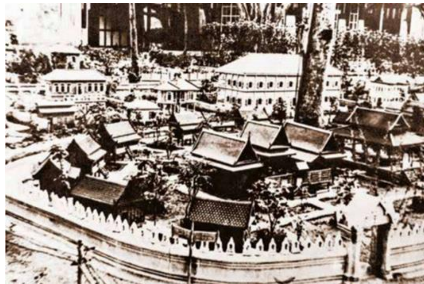
เมืองจำลองดุสิตธานี ทดลองการปกครองแบบประชาธิปไตย (อ้างอิง : หนังสือ ใต้ร่มพระบารมี ๒๓๗ ปี กรุงรัตนโกสินทร์ โดย กระทรวงวัฒนธรรม )