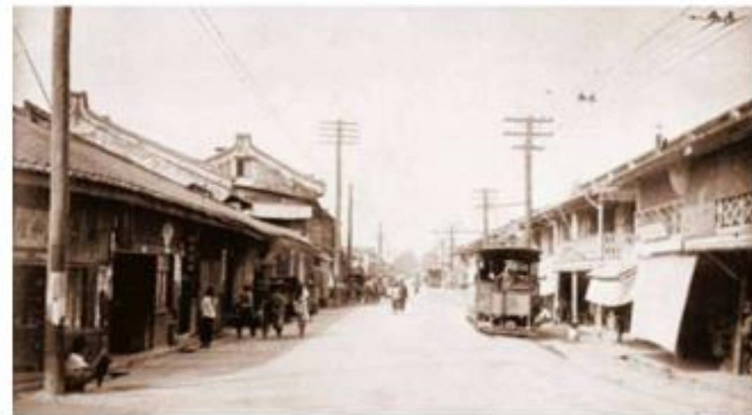
ถนนเจริญกรุง (อ้างอิง : หนังสือ ได้รบพระบารมี ๒๓๗ ปี กรุงรัตนโกสินทร์ โดย กระทรวงวัฒนธรรม)