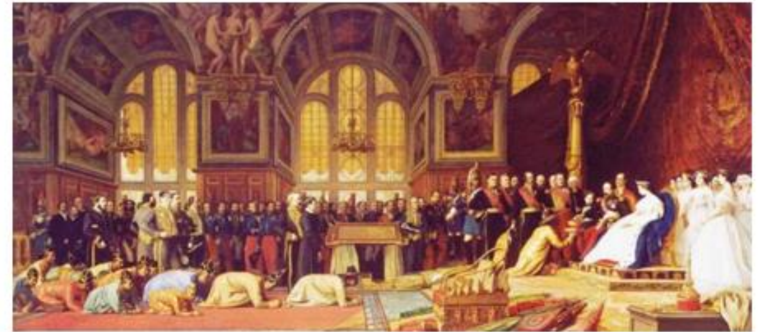
คณะราชทูตสยามเข้าเฝ้าจักรพรรดินโปเลียนที่ ๓

ณ พระราชวังฟงแตนโบล วันที่ ๒๗ มิถุนายน พ.ศ. ๒๔๐๔