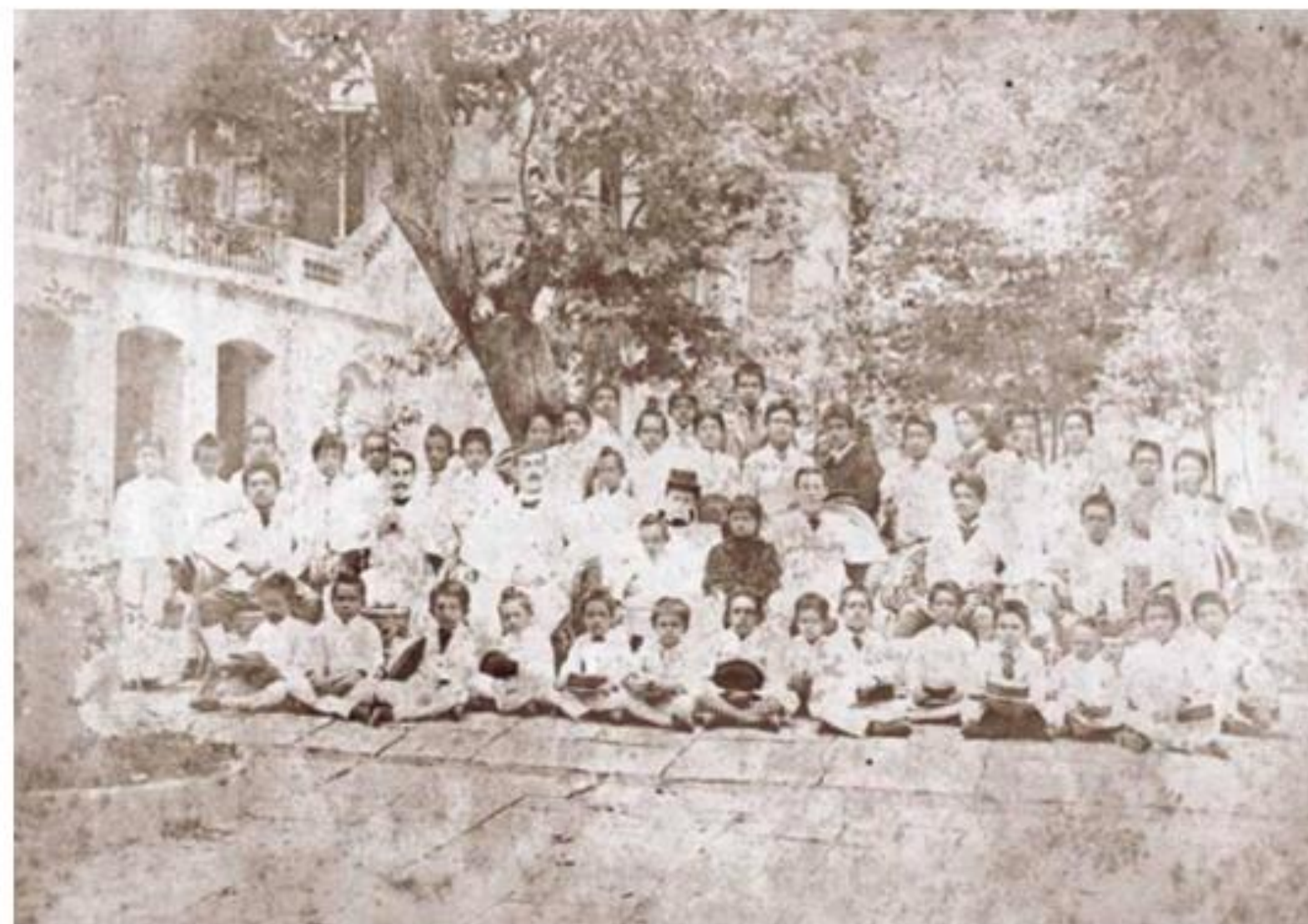
โรงเรียนราชวิทยาลัย พระบาทสมเด็จพระจุลจอมเกล้าเจ้าอยู่หัวโปรดเกล้าฯ ให้ก่อตั้งขึ้น โดยมีพระราชประสงค์ให้เป็นโรงเรียนเน้นการสอนวิชาภาษาอังกฤษ เพื่อเตรียมความพร้อมไปศึกษาต่อ

ในสมัย พระบาทสมเด็จพระจอมเกล้าเจ้าอยู่หัวไทยได้มีความสัมพันธ์ติดต่อกับต่างประเทศมากขึ้น พระบาทสมเด็จพระจอมเกล้าเจ้าอยู่หัวทรงเห็นว่าการติดต่อสัมพันธ์กับต่างประเทศเหล่านั้นได้อย่างทัดเทียมเสมอกัน จำเป็นต้องมีการศึกษาตามแบบอย่างของประเทศเหล่านั้นพระองค์จึงชักชวนให้สตรีในคณะมิชชันนารีชาวอเมริกันเป็นครูสอนภาษาอังกฤษ และให้ความรู้ทั่วไปแก่สตรีในวังใน พ.ศ. ๒๔๐๔ โปรดเกล้าจ้าง นางแอนนา เลียวโนเวนส์ ชาวอังกฤษเข้ามาเป็นครูสอนภาษาอังกฤษ วิทยาศาสตร์ และวรรณคดีให้กับพระราชโอรสและพระราชธิดาในพระบรมมหาราชวัง และทรงสนับสนุนให้บาทหลวงและมิชชันนารีตั้งโรงเรียนทั้งในพระนครและต่างจังหวัด