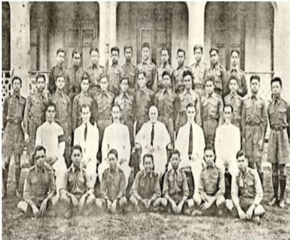
คณะครูและนักเรียนโรงเรียนสวนกุหลาบวิทยาลัย (อ้างอิง : พิพิธภัณฑสถานศึกษาไทย โรงเรียนสวนกุหลาบวิทยาลัย )

ในสมัยพระบาทสมเด็จพระจุลจอมเกล้าเจ้าอยู่หัวพระองค์ทรงเล็งเห็นความสำคัญของการศึกษาว่าเป็นส่วนสำคัญในการปรับปรุงประเทศให้ทันสมัยตามแบบตะวันตกจึงโปรดเกล้าให้ปฏิรูปการศึกษาด้วยสาเหตุต่อไปนี้