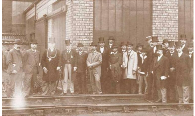
เสด็จประพาสยุโรป เมืองนิวคาสเซิล ประเทศอังกฤษ

ในรัชสมัยพระบาทสมเด็จพระจุลจอมเกล้าเจ้าอยู่หัว (รัชกาลที่ ๕) มีการเสียดินแดนให้แก่ชาติมหาอำนาจตะวันตกเป็นจำนวนมาก ซึ่งมีแนวคิดในการปกครองว่า “ยอมเสียแขนขา เพื่อรักษาหัวใจ” (โดยทรงน้อมนำแนวพระราชดำริที่ต่อเนื่องมาตั้งแต่รัชกาลที่ ๔) โดยยอมทำสนธิสัญญาที่เสียเปรียบเพื่อรักษาเอกราชของชาติไทยไว้ นอกจากนี้ยังมี การปรับปรุงระเบียบบริหารราชการแผ่นดิน โปรดเกล้า ฯ จัดตั้งสภาที่ปรึกษา ๒ สภา การปฏิรูปการปกครองส่วนกลาง มีการจัดตั้งกระทรวง การปฏิรูปการปกครองส่วนภูมิภาค เช่น การจัดตั้งมณฑล โดยรวมหัวเมืองต่าง ๆ ที่อยู่ใกล้กัน ปฏิรูปการปกครองส่วนท้องถิ่น โดยการจัดตั้งสุขาภิบาล การปฏิรูปบ้านเมืองให้ทันสมัยโดยการก่อสร้างสถาปัตยกรรมที่เป็นรูปแบบเหมือนกับชาติตะวันตก รวมถึงการเจริญสัมพันธไมตรีกับมหาอำนาจในยุโรป จากการเสด็จประพาสยุโรป ในปี พ.ศ. ๒๔๔๐ และ พ.ศ. ๒๔๕๐