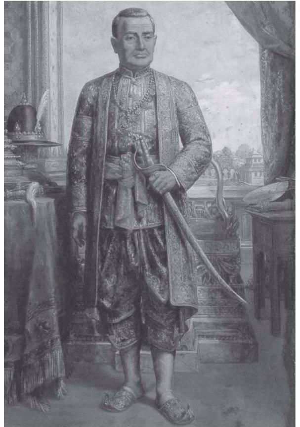
พระบาทสมเด็จพระพุทธยอดฟ้าจุฬาโลกมหาราช

พระมหากษัตริย์รัชกาลที่ ๑ แห่งกรุงรัตนโกสินทร์ มีพระนามเดิมว่า ดั่ง หรือทองดั่ง เสด็จพระราชสมภพที่กรุงศรีอยุธยา เมื่อวันที่ ๒๐ มีนาคม พ.ศ. ๒๒๗๙ ในรัชกาลสมเด็จพระเจ้าอยู่หัวบรมโกศเป็นพระโอรสในสมเด็จพระปฐมบรมมหาชนกซึ่งมีพระนามเดิมว่า ทองดี สืบเชื้อสายมาจาก เจ้าพระยาโกษาธิบดี (ปาน) ในสมัยสมเด็จพระนารายณ์มหาราช พระราชชนนีมีพระนามว่า หยก หรือดาวเรือง เมื่อทรงเจริญพระชนมพรรษาได้ถวายตัวเป็นมหาดเล็กในสมเด็จพระเจ้าอยู่หัวมอญ ขณะดำรงพระยศเป็นสมเด็จพระเจ้าลูกยาเธอ เมื่อทรงอุปสมบทและลาผนวชแล้วกลับเข้ารับราชการเป็นมหาดเล็กหลวง เมื่อมีพระชนมพรรษา ๒๕ พรรษา สมเด็จพระเจ้าเอกทัศทรงพระกรุณาโปรดเกล้าฯ ให้เป็นหลวงยกกระบัตรเมืองราชบุรี และได้สมรสกับธิดาตระกูลคหบดีที่ตำบลอัมพวา แขวงเมืองสมุทรสาคร ชื่อ นาก (สมเด็จพระอมรินทราบรมราชินี)