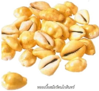
หอยเบี้ยสมัยรัตนโกสินทร์

จังกอบหรือภาษีผ่านด่าน เก็บจากการนำสินค้าเข้ามาขาย หรือส่งออก ภายในราชอาณาจักร โดยชัก ส่วนสินค้าหรือเก็บตามขนาดยานพาหนะ (ภาษีปากเรือ)