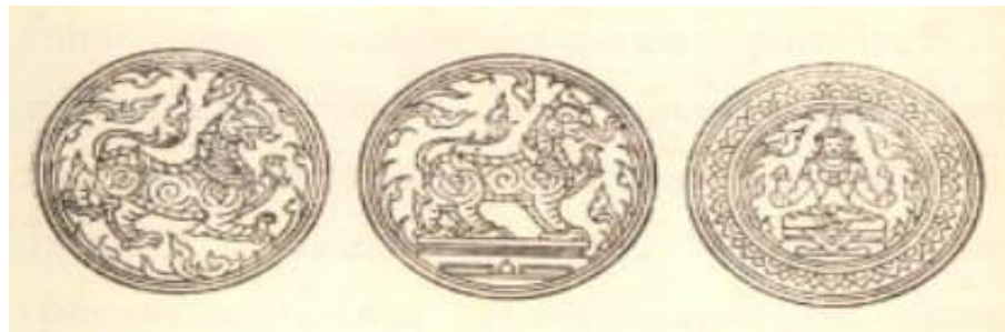
กฎหมายตราสามดวง (จากซ้ายไปขวา ตราราชสีห์ ตราคชสีห์ ตราบัวแก้ว)

(อ้างอิงจาก : หนังสือกฎหมายตราสามดวง เล่ม ๒ โดยกรมศิลปากร)