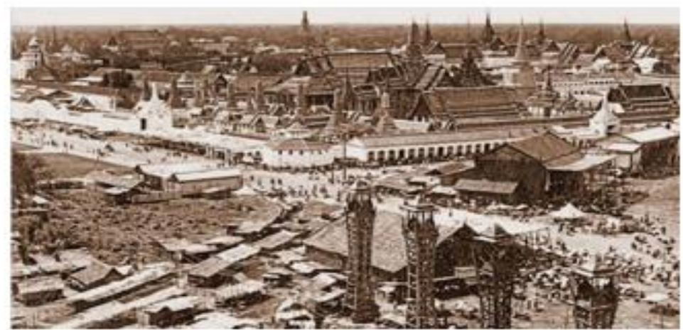
กรุงรัตนโกสินทร์ในอดีต (อ้างอิงจาก : หนังสือได้วันพระนามปี ๒๕๒๗ ปี กรุงรัตนโกสินทร์ โดยกระทรวงวัฒนธรรม)

๓. รากฐานการพัฒนาบ้านเมืองและบริหารประเทศเพื่อความมั่นคง อาณาจักรรัตนโกสินทร์รับอารยธรรมและความเจริญด้านต่าง ๆ สืบต่อมาจากกรุงศรีอยุธยาและกรุงธนบุรี จัดการบ้านเมืองให้มีความสงบและเจริญรุ่งเรืองเช่นเดียวกับ กรุงศรีอยุธยาไปรทเกล้าให้มีการชำระกฎหมายที่มีอยู่เดิมให้เป็นหมวดหมู่ เพื่อฟื้นฟูศิลปวัฒนธรรมของชาติและเสริมสร้างความมั่นคงให้อาณาจักร โดยทำการสงครามป้องกันการค้าจากพม่าและขยายขอบเขตอาณาจักรให้กว้างขวางได้ เป็นผลให้บ้านเมืองมีเสถียรภาพที่มั่นคงทำให้สามารถรวบรวมช่วยและบรรณาการที่เป็นทรัพยากรอันมีค่าจากประเทศราชต่าง ๆ มาเสริมสร้างความมั่งคั่งในอาณาจักรอีกด้วย