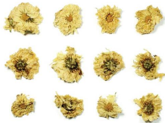
ดอกเก๊กฮวย