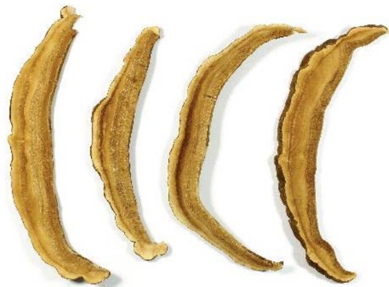
เห็ดหลินจือ