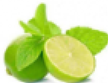
มะนาว แปลว่า มโน