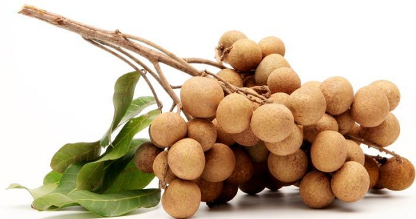
ลำไย (รำคาญ)