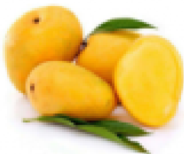
มะม่วง แปลว่า ไม้,ควาย