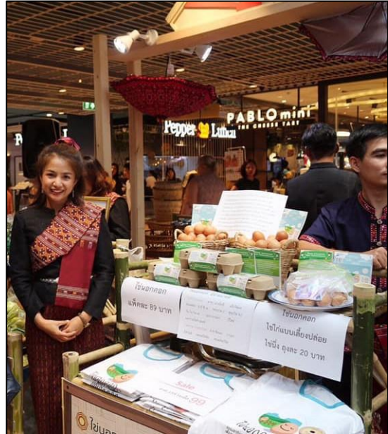
ผลิตภัณฑ์ทางการเกษตรชุมชน จัดเป็นสินค้าที่มีการผลิตโดยชุมชน เพื่อชุมชน

โดยการผลิตสินค้าหรือบริการนั้นสามารถแบ่ง ออกเป็นส่วนย่อยได้ ๒ ส่วนคือ เศรษฐทรัพย์ และ ทรัพย์ เสรี