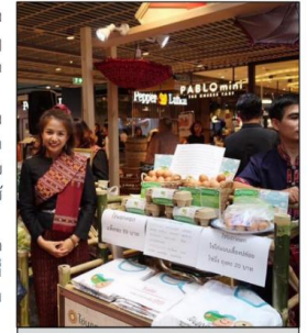
ผลิตภัณฑ์ทางการเกษตรชุมชน จัดเป็นสินค้าที่มีการผลิตโดยชุมชน เพื่อชุมชน