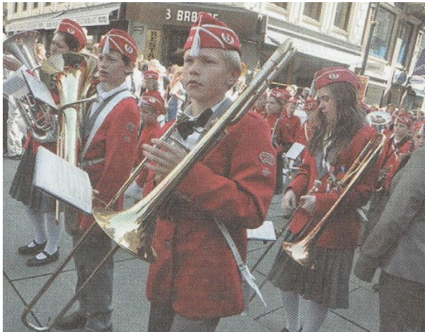
ภาพนักเรียนชาวนอร์เวย์ เชื้อชาติคอเคซอยด์