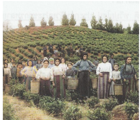
เกษตรกรชาวกรีก เชื้อชาติคอเคซอยด์ กลุ่มเมดิเตอร์เร