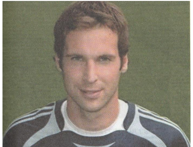
ชาวเช็ก เชื้อชาติคอเคซอยด์ กลุ่มแอลไพน์