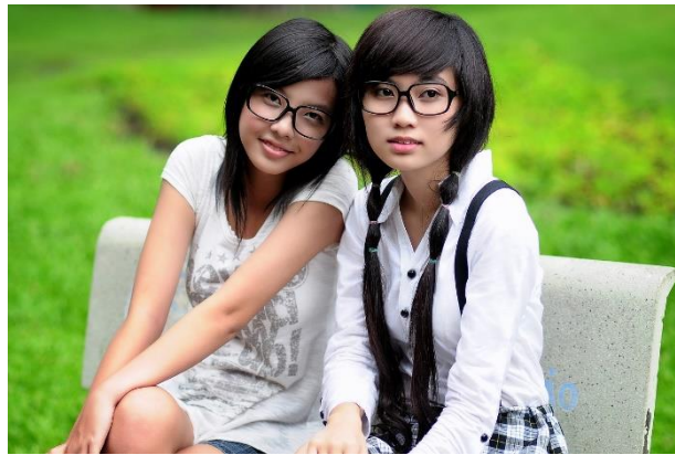
ภาพประชากรกลุ่มมองโกลอยด์