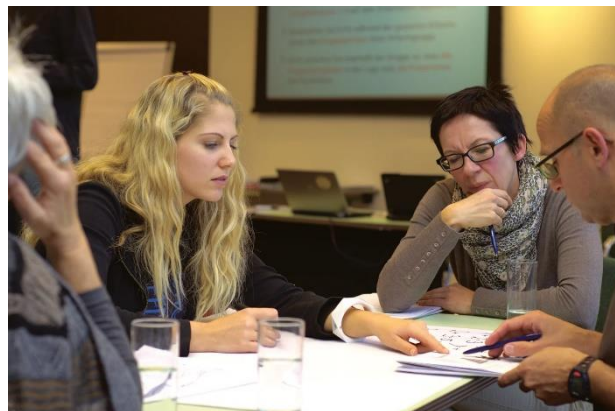
ภาพประชากรกลุ่มคอเคซอยด์