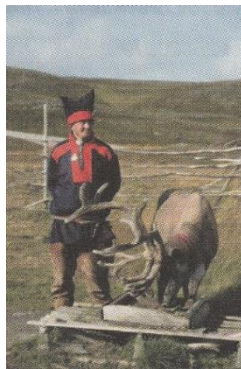
ชาวแลมป์ หรือ ซามิ มีเชื้อสายมองโกลลอยด์ อยู่ประเทศสวีเดน และฟินแลนด์