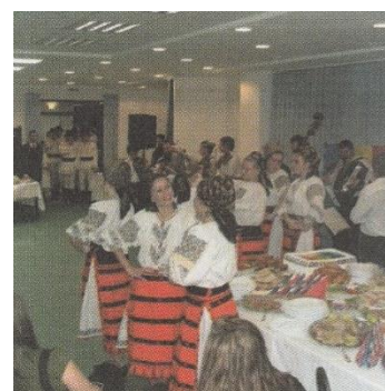
ชาวแมกยสรในประเทศฮังการี มีเชื้อสายมองโกลลอยด์

กระทรวงศึกษาธิการ. (2554). หน้าที่พลเมือง วัฒนธรรมและการดำเนินชีวิตในสังคม เศรษฐศาสตร์ และภูมิศาสตร์ มัธยมศึกษาปีที่ 2. กรุงเทพฯ : โรงพิมพ์ สกศค. ลาดพร้าว