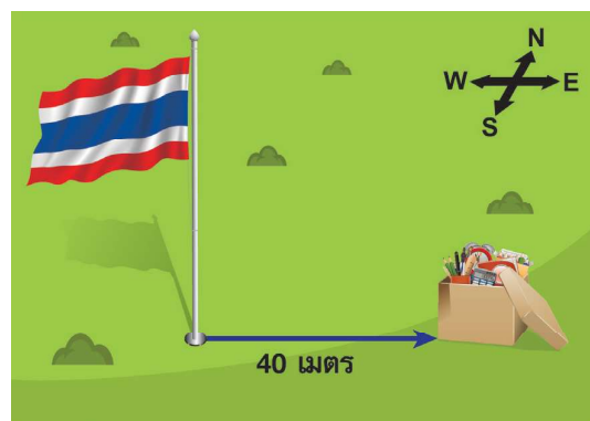
ตำแหน่งของวัตถุห่างจากเสาธง 40 เมตร ไปทางทิศตะวันออก