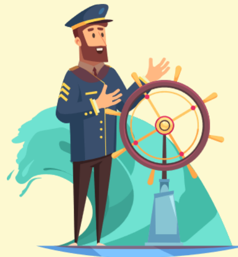
กัปตันเรือ