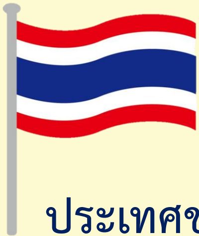
ประเทศชาติ

เปรียบประเทศชาติเหมือนเรือที่อยู่กลางมหาสมุทร