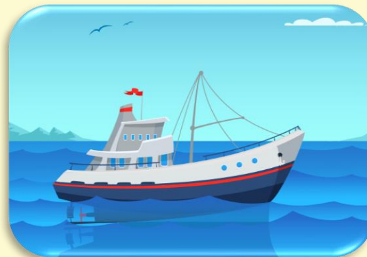
เรือที่อยู่กลางมหาสมุทร