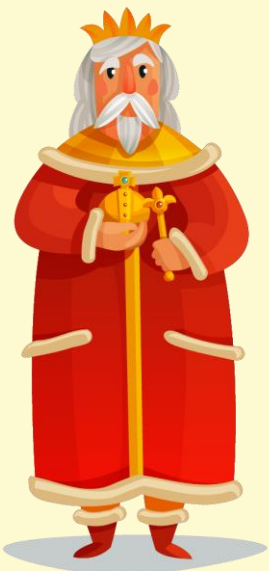
พระมหากษัตริย์