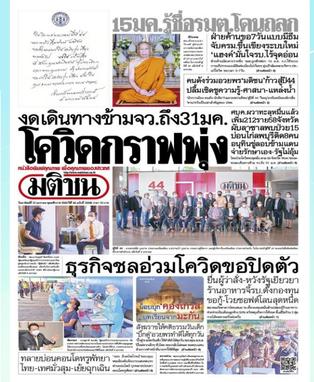
ภาพ หนังสือพิมพ์มติชน จาก https://www.matichon.co.th/newspaper-cover/news_๒๕๒๑๕๕๑