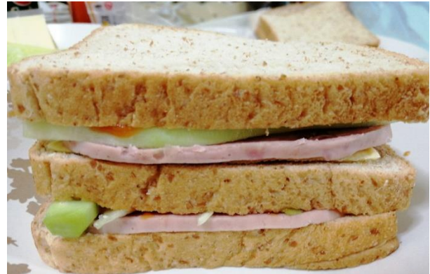
ขอขอบคุณข้อมูลและรูปภาพประกอบจาก https://www.wongnai.com/recipes/ugc/9905e66c75234f4b9d819d00a36481a7?ref=ct