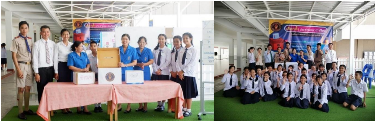
การใช้สิทธิออกเสียงเลือกตั้งตามระบอบประชาธิปไตย ของโรงเรียนวังไกลกังวล ในพระบรมราชูปถัมภ์

สมาชิกในชุมชนควรมีส่วนร่วมในกิจกรรมต่าง ๆ ตามกระบวนการประชาธิปไตย เช่น การออกเสียงเลือกตั้งผู้นำชุมชนเข้าร่วมประชุมเพื่อแสดงความคิดเห็น เช่น การออกเสียงเลือกตั้งในโรงเรียน การเลือกตั้งผู้นำชุมชน เข้าร่วมประชุมเพื่อแสดงความคิดเห็น การมีส่วนร่วมในการพัฒนาโรงเรียนและชุมชนในด้านต่าง ๆ