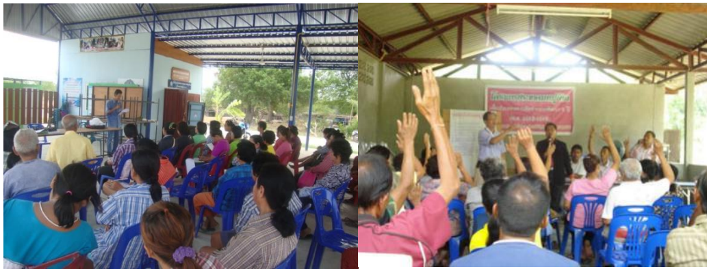
การเข้าไปมีส่วนร่วมในการแสดงความคิดเห็นที่เป็นประโยชน์ต่อชุมชน