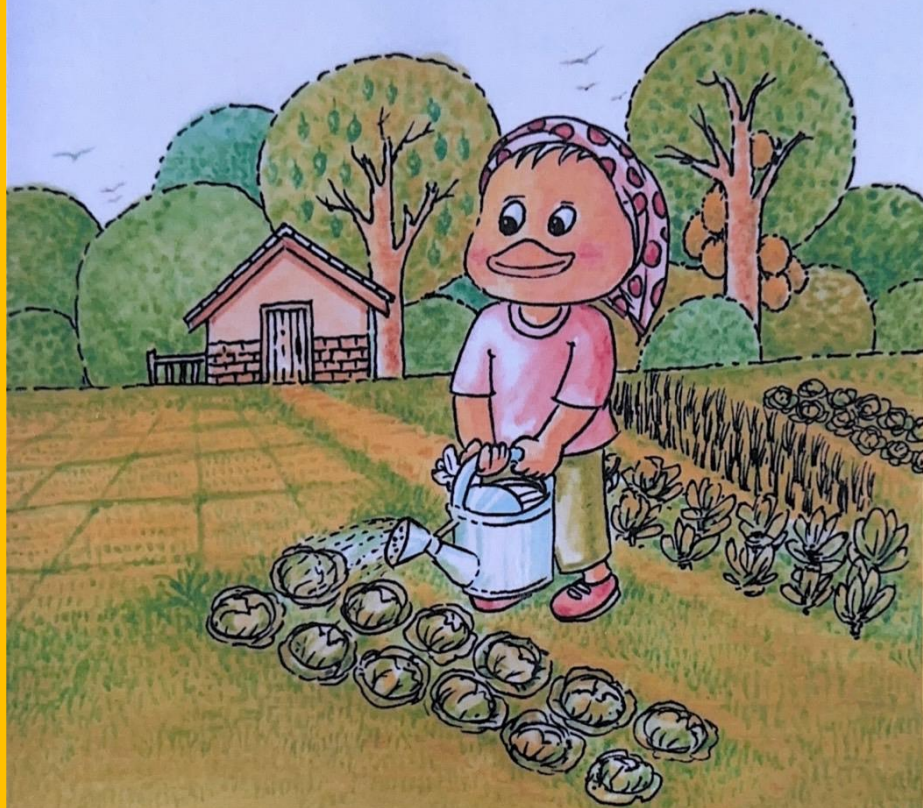
เปิดปลูกผัก น่านิยม