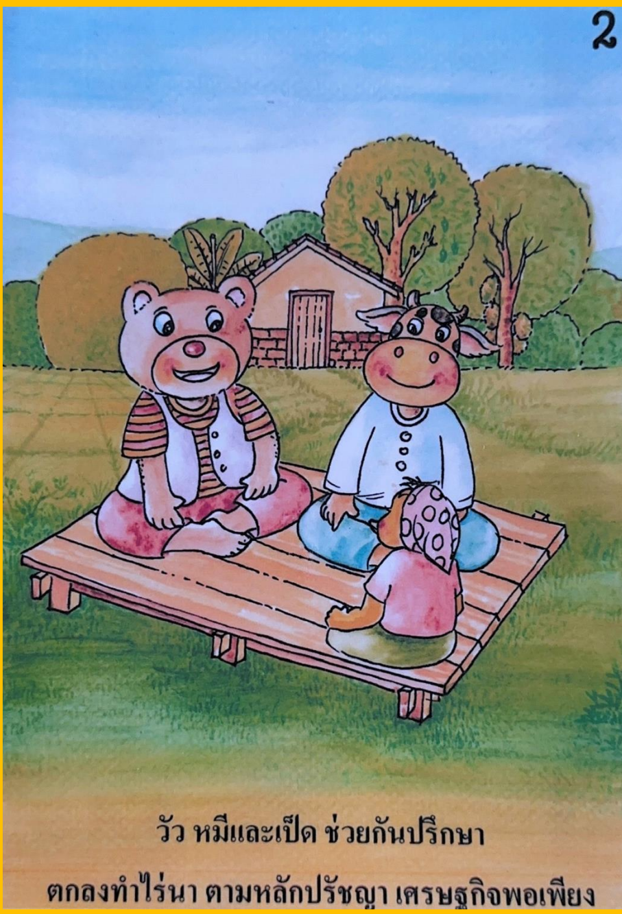
วัว หมู และเป็ด ช่วยกันปรึกษา ตกลงทำไร่นา ตามหลักปรัชญา เศรษฐกิจพอเพียง