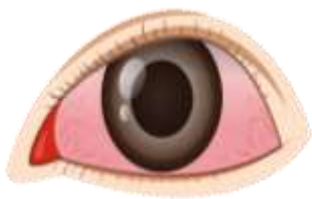
a pink eye

ใบความรู้ที่ 4 เรื่อง Pain (ต่อ) หน่วยการเรียนรู้ที่ 3 เรื่อง Healthy Living แผนการจัดการเรียนรู้ที่ 4 เรื่อง Going to the Hospital รายวิชา ภาษาอังกฤษ รหัสวิชา อ14101 ภาคเรียนที่ 1 ชั้นประถมศึกษาปีที่ 4