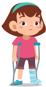
a broken leg