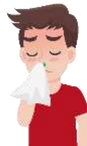
a runny nose