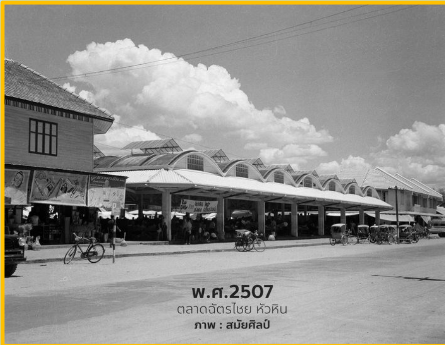
พ.ศ.2507 ตลาดจัตุรโยย หัวหิน