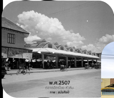
พ.ศ.2507 ตลาดสดโฮง หัวหิน