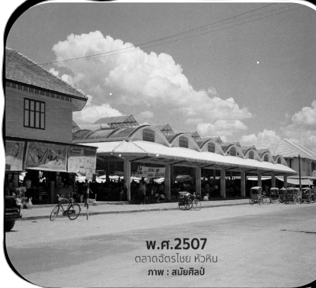
พ.ศ.2507 ตลาดจตุรไชย หัวหิน