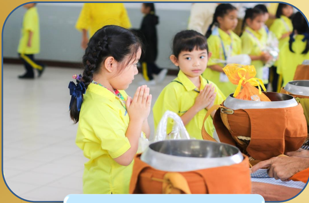
ทำบุญตักบาตร