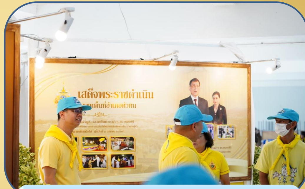
จัดนิทรรศการแสดงพระราชประวัติ และพระราชกรณียกิจของพระองค์

วันเฉลิมพระชนมพรรษาพระบาทสมเด็จพระเจ้าอยู่หัว