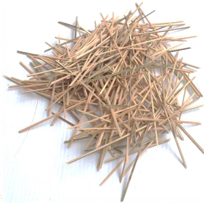
๒. ไม้กลัด