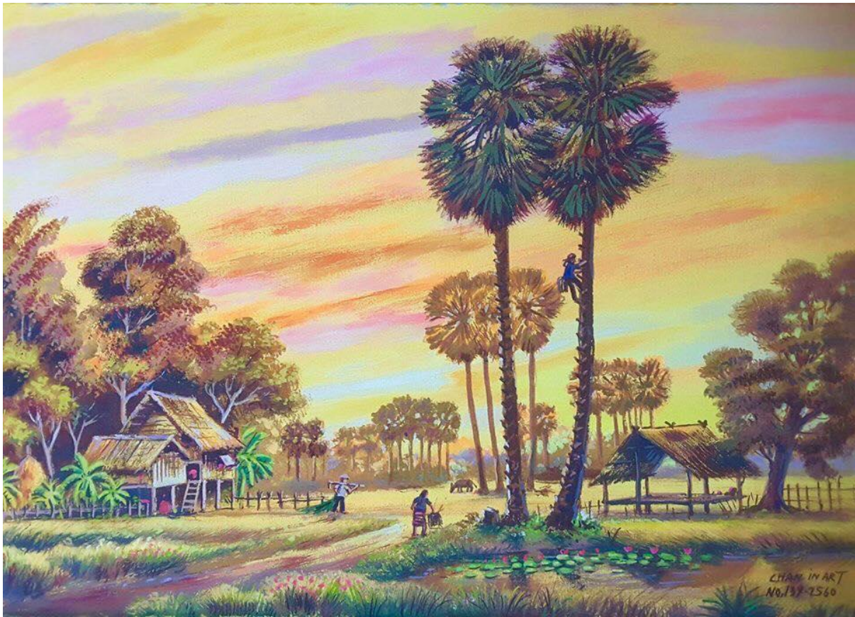
ภาพวาดชนบท