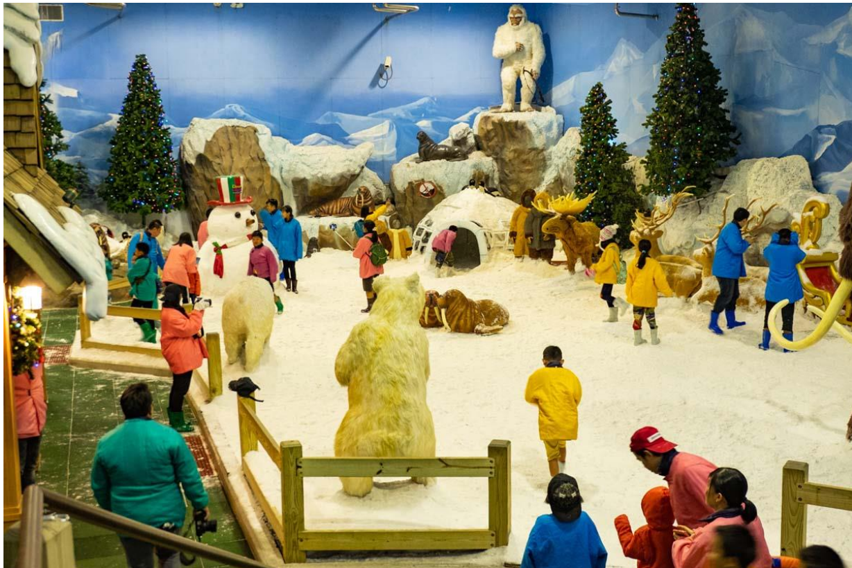
ภาพเมืองหิมะ เมือง