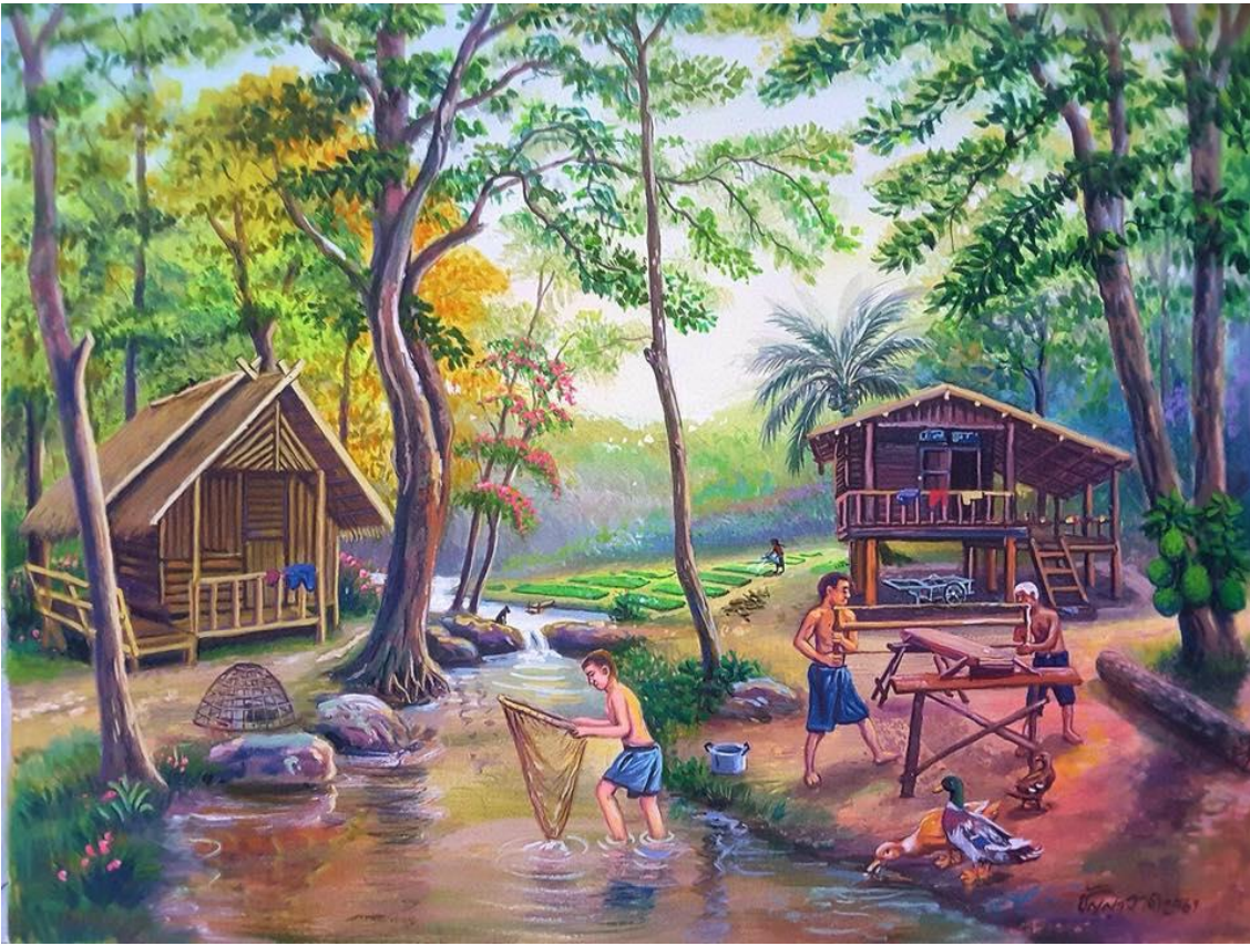
พวาดชนบท