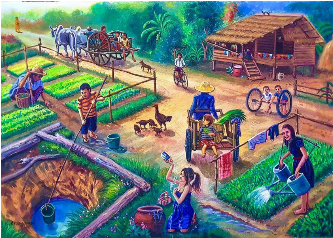
คชนบท