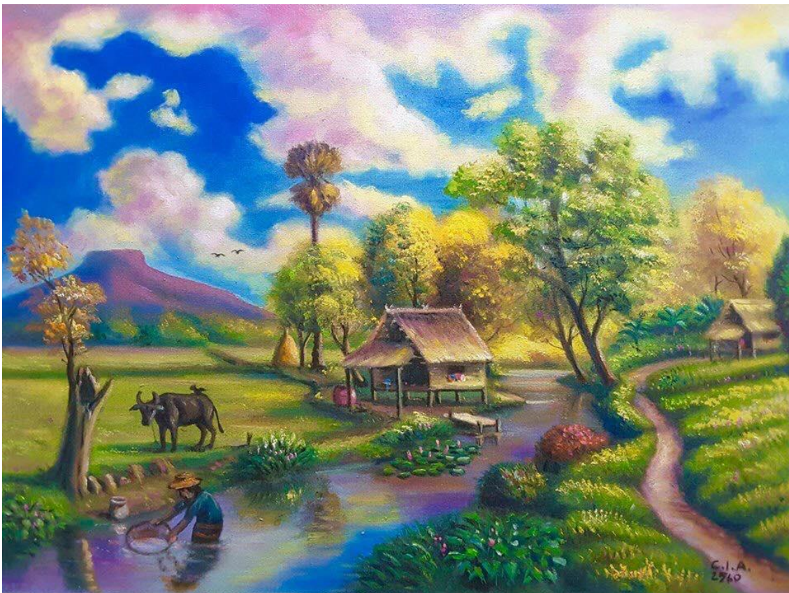
ภาพวาดชนบท