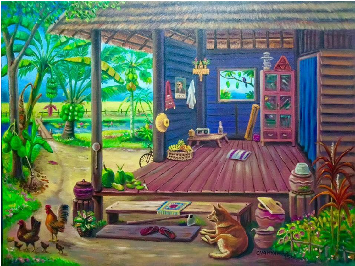
ภาพวาดชนบท