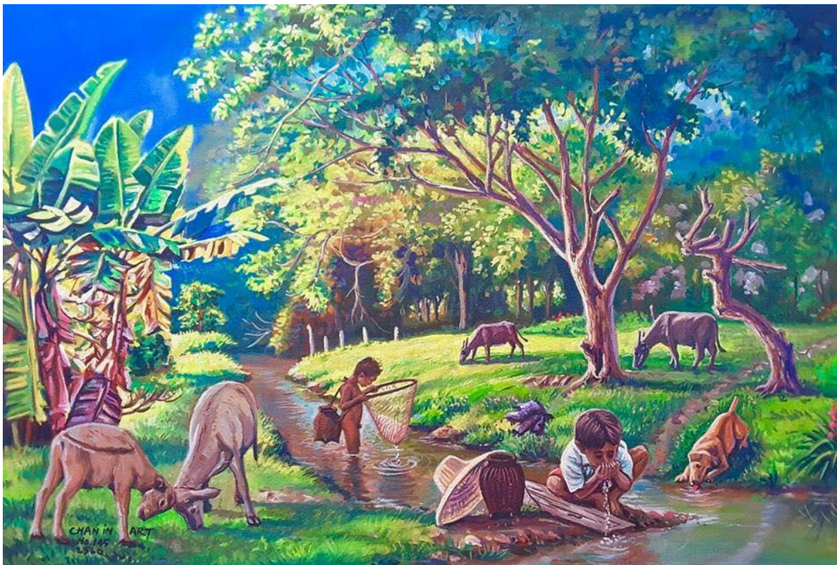
ภาพวาดชนบท