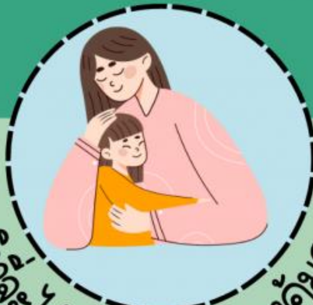
สิทธิที่จะได้รับการปกป้องคุ้มครอง

● สิทธิในการอยู่รอดปลอดภัย ตั้งแต่เมื่อคลอดตลอดจนได้รับการเลี้ยงดูที่ได้มาตรฐาน