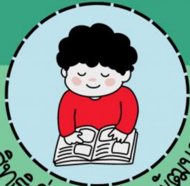
สิทธิที่จะได้รับการพัฒนา

● สิทธิที่จะได้รับการปกป้องคุ้มครองจากการล่วงละเมิด และทารุณกรรมทุกรูปแบบ ทั้งด้านร่างกายและจิตใจ