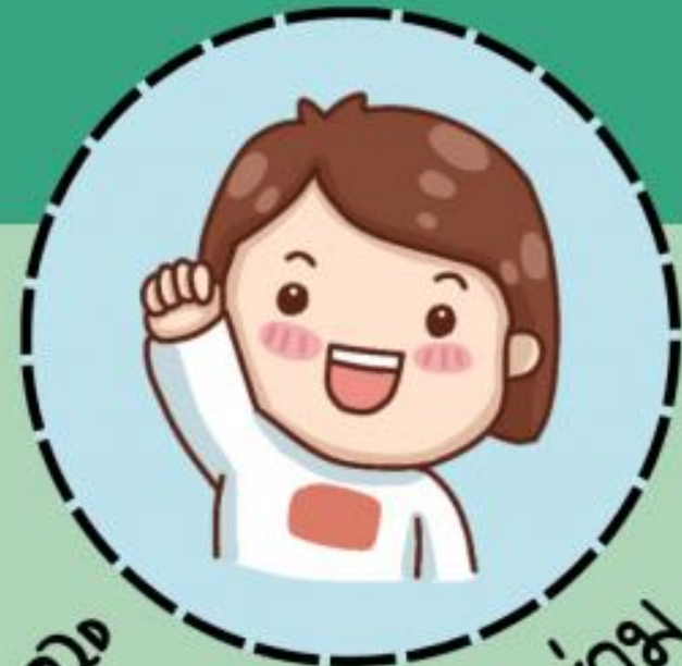
สิทธิที่จะมีส่วนร่วม

● สิทธิที่จะได้รับการส่งเสริมพัฒนาการ และการสนับสนุนในด้านการศึกษาตามมาตรฐานทุกรูปแบบ