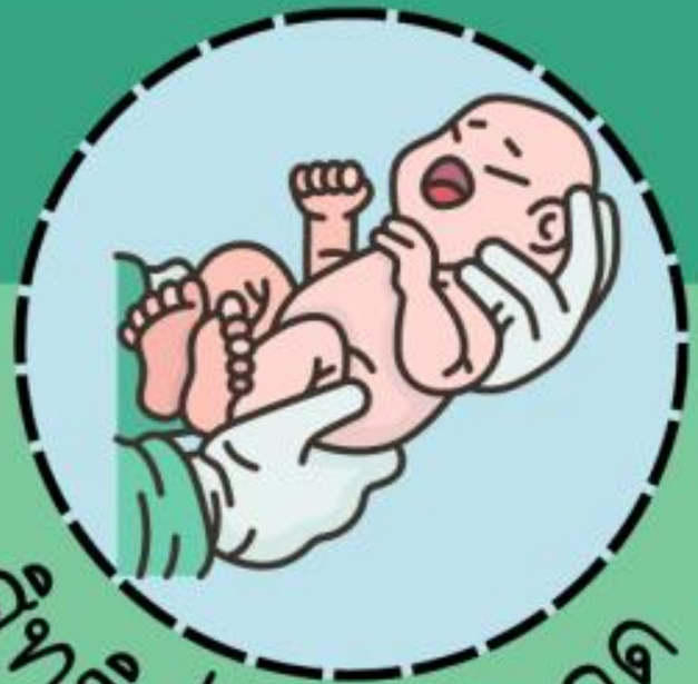
สิทธิที่จะมีชีวิตรอด

● สิทธิในการอยู่รอดปลอดภัย ตั้งแต่เมื่อคลอดตลอดจนได้รับการเลี้ยงดูที่ได้มาตรฐาน