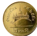
เหรียญ 2 บาท