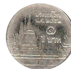
เหรียญ 1 บาท