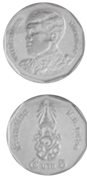
เหรียญ 5 บาท