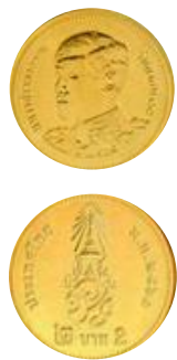
เหรียญ 2 บาท