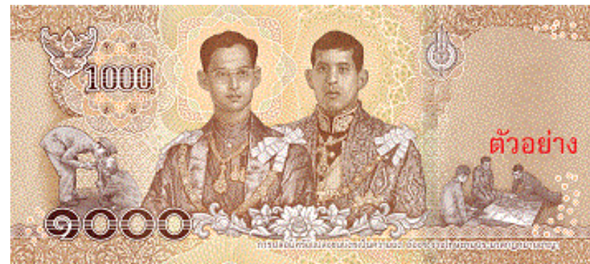
ธนบัตรชนิดราคา ๑๐๐๐ บาท แบบ ๑๗