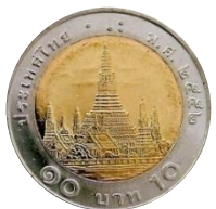
เหรียญ 10 บาท