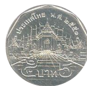
เหรียญ 5 บาท