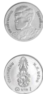
เหรียญ 1 บาท