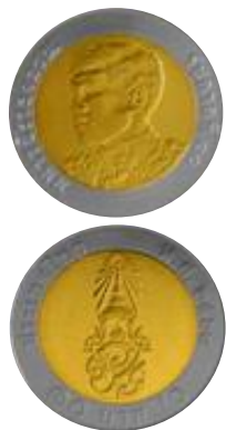
เหรียญ 10 บาท