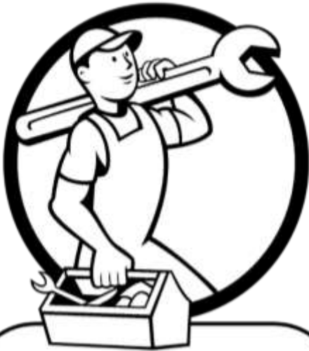
เครื่องมือช่าง

คำชี้แจง ให้นักเรียนเขียนชื่อและประเภทของเครื่องมือช่างให้ถูกต้อง พร้อมระบายสีให้สวยงาม