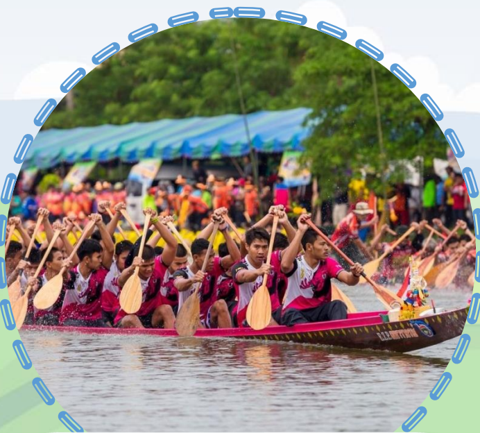
แข่งเรือยาว