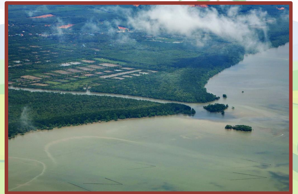
โคลนตะกอนที่ทับถมกันจนเป็นผืนดิน

เขตที่ราบภาคกลางตอนล่าง เป็นที่ราบกว้างที่เกิดจากการทับถม ของตะกอน และเกิดเป็นดินดอน สามเหลี่ยมปากแม่น้ำเจ้าพระยา