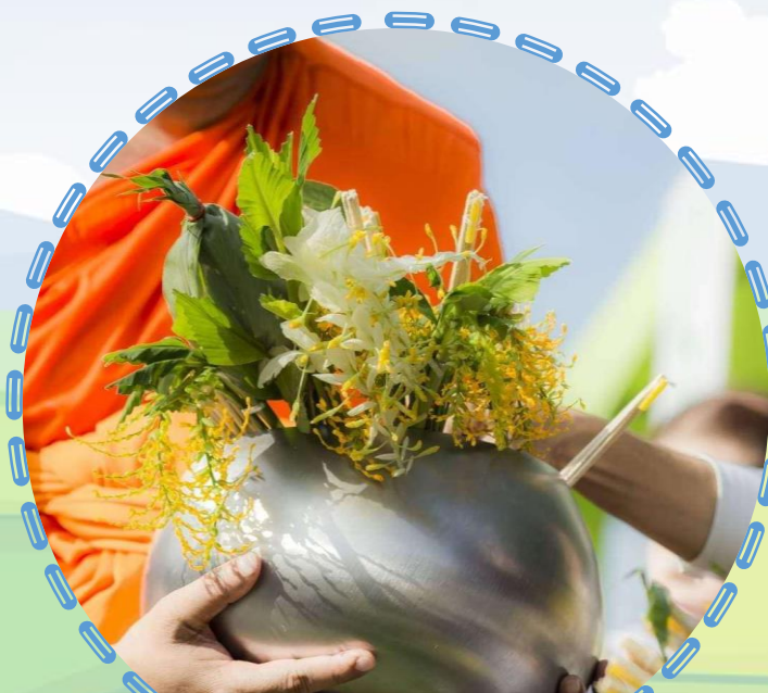
ตักบาตรดอกไม้