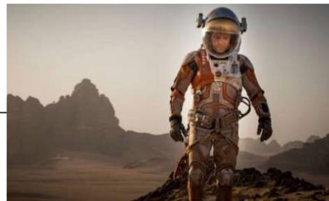
ภาพจากภาพยนตร์เรื่อง THE MARTIAN