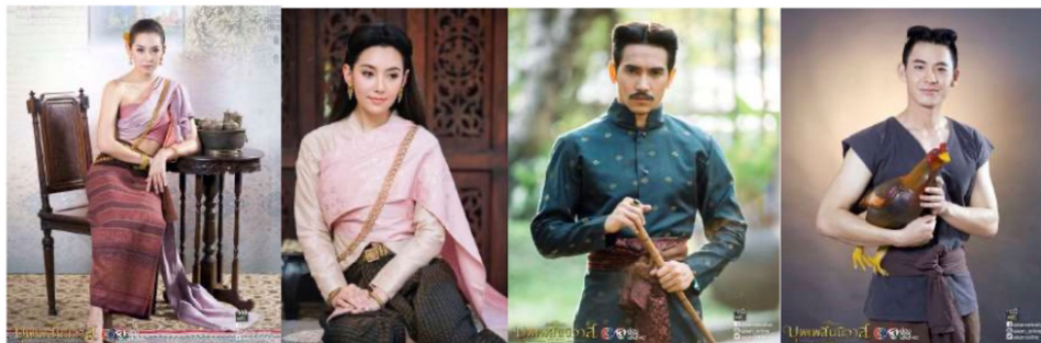
ภาพจากละครเรื่อง บุพเพสันนิวาส

นำเสนอลักษณะการแต่งกายของผู้คนในแต่ละสมัย ที่มีเอกลักษณ์เฉพาะของตน ดังนั้นเครื่องแต่งกายที่ตัวละครสวมใส่สามารถแสดงถึงยุคสมัยและแสดงถึงวิถีชีวิต ค่านิยมของผู้คนในสมัยนั้นๆ ได้