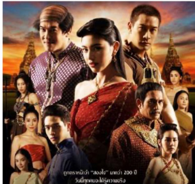
ภาพจากละครเรื่อง วันทอง

การแต่งกายของนักแสดงจะทำให้เราราบเกี่ยวกับเนื้อหา เรื่องราวและประเภทของละครแบบพอสังเขป