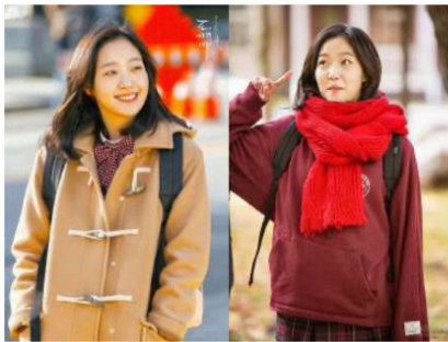
ภาพจากละครเรื่อง GOBLIN

เครื่องแต่งกายแต่ละประเภทมีหน้าที่และมีข้อจำกัดในการใช้ต่างกัน เช่น สภาพแวดล้อมที่มีอากาศหนาวเย็น ตัวละครจะสวมใส่เสื้อแขนยาวหนา ดังนั้นคนดูก็จะสามารถเข้าใจได้ถึงลักษณะอากาศและภูมิประเทศนั้นๆ