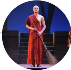
ภาพจากละครเวที เรื่อง พระร่วง