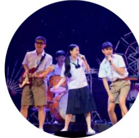
ภาพจากละครเวที เรื่อง แฟนจ๋า เดอะมิวสิคัล