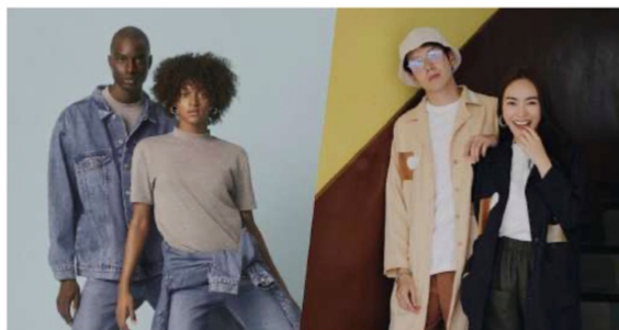
เครื่องแต่งกายแบบ GENDER NEUTRAL

โดยทั่วไปผู้ที่อยู่ในวัยต่างกันจะสวมเสื้อผ้าไม่เหมือนกัน เช่น วัยเด็ก จะสวมเสื้อผ้าต่างกับวัยผู้ใหญ่ โดยที่เสื้อผ้าของวัยเด็กจะเน้นความสะดวกสบายในการทำกิจกรรมโดยเสื้อผ้าจะไม่ขัดต่อพัฒนาการ จะต้องมีความปลอดภัยต่อการสวมใส่ ไม่คับและหลวมเกินไป สีสันสดใส เป็นต้น ส่วนในเรื่องของเพศ ในอดีตผู้หญิงและผู้ชาย จะสวมเสื้อผ้าในลักษณะที่แตกต่างกันและมีการแบ่งแยกชัดเจน แต่ในปัจจุบันเริ่มมีการให้ความสำคัญกับความเท่าเทียมระหว่างหญิงและชายมากขึ้น ทำให้เกิดกระแสนิยมหรือเทรนด์ใหม่เข้ามา ชื่อว่า Gender neutral style เป็นการแต่งตัวด้วยเสื้อผ้าที่ไม่ระบุเพศ ผู้หญิงใส่ก็ได้ ผู้ชายใส่ก็ได้