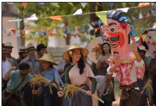
ภาพที่ ๑ เดินกำรำเคียว

๒) ดนตรีช่วยสะท้อนให้เห็นวิถีชีวิต สภาพสังคม การดำเนินชีวิตของชุมชนในสมัยต่าง ๆ เช่น เพลงโน้มน้ำมีปลา - โนนามีข้าว ซึ่งบ่งบอกถึงความสุข ความอุดมสมบูรณ์ของชาติไทยในกรุงสุโขทัย เพลงเดินกำรำเคียว ซึ่งบ่งบอกถึงความสนุกสนานของคนประกอบอาชีพทำนา ชาวนาในการประกอบอาชีพ เชื้อแห่งไข่มดแดง การแสดงทางภาคอีสาน ฟ้อนสาวไหม การแสดงทางภาคเหนือ ระเบ้าร้อนแร่ การแสดงทางภาคใต้ เป็นต้น (สุมาลี นิรมานภาพ, ๒๕๖๑)