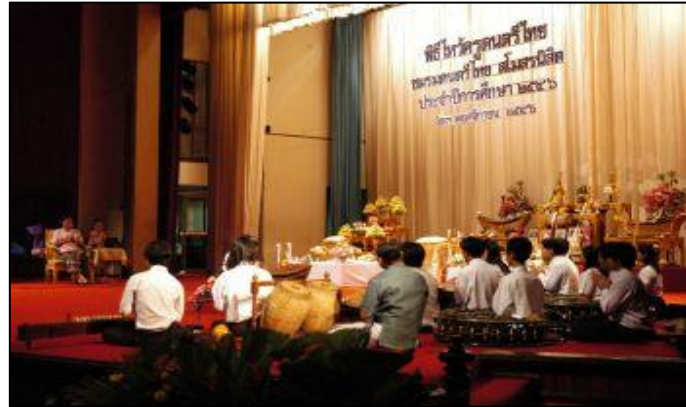
ภาพที่ ๒ พิธีไหว้ครูดนตรีไทย

๓) ดนตรีเป็นเครื่องบรรเลงในพิธีกรรมต่าง ๆ ในสังคมไทย ซึ่งมีพิธีกรรมต่าง ๆ มากมายทั้งที่เป็นงานมงคล งานอวมงคล รวมถึงการประกอบพิธีทางศาสนา ทำให้เกิดความศักดิ์สิทธิ์น่าเชื่อถือ สร้างอารมณ์ได้เป็นอย่างดี เช่น เพลงสาธุการ ใช้เวลาจุดธูปเทียนบูชาพระ ผู้ฟังจะรู้สึกถึงความขลัง ความศรัทธา เป็นต้น (สงบศึก ธรรมวิหาร, ๒๕๔๕)