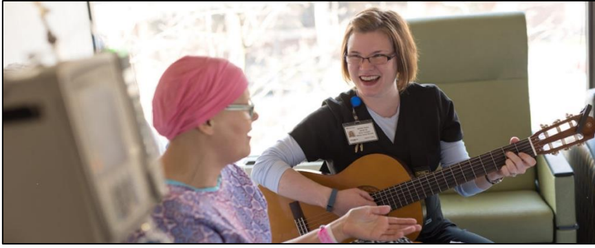
ภาพที่ ๑ ดนตรีบำบัด

๓) ดนตรีกับการพัฒนาด้านกล้ามเนื้อ คือ ดนตรีเป็นกิจกรรมหนึ่งที่น่าอกจากจะใช้เรื่องของโสตประสาทแล้ว การเต้นรำตามจังหวะดนตรี การเล่นเครื่องดนตรีต่าง ๆ จำเป็นต้องอาศัยการใช้กล้ามเนื้อส่วนต่าง ๆ ควบคุมไปกับการใช้โสตประสาทด้วย ความแข็งแรงของกล้ามเนื้อ การควบคุมกล้ามเนื้อ เป็นปัจจัยที่ช่วยให้การเล่นเครื่องดนตรีมีความสมบูรณ์แบบมากยิ่งขึ้น การเล่นดนตรีจะช่วยพัฒนากล้ามเนื้อมัดใหญ่และมัดเล็กไปพร้อมกัน และช่วยพัฒนากล้ามเนื้อมัดเล็กในส่วนที่ใช้เล่นเครื่องดนตรีได้ดีในเด็กเล็กช่วง ๕ ขวบ อย่างไรก็ตามดนตรีก็สามารถช่วยพัฒนากล้ามเนื้อในวัยอื่น ๆ ได้เช่นกัน เนื่องจากทักษะดนตรีต้องอาศัยระยะเวลาในการฝึกฝนจนชำนาญ การใช้กล้ามเนื้อซ้ำ ๆ เป็นระยะเวลานาน จะทำให้กล้ามเนื้อเกิดความคงทน แข็งแรง นอกจากนี้ คนที่เล่นดนตรีมาเป็นระยะเวลานาน อาจจะได้เปรียบเรื่องการแยกระบบประสาทในการใช้กล้ามเนื้อที่ซับซ้อนด้วย (เสาวนีย์ สังข์โสภณ, ๒๕๕๓)