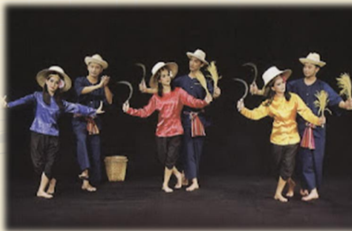
B การแสดงเต้นกำรำเคียว