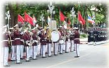
A วงโยธวาทิตบรรเลงเพลงมหาฤกษ์

๑. จากสถานการณ์ที่กำหนด ให้นักเรียนเลือกสถานการณ์ ๑ สถานการณ์ พร้อมอธิบายว่า ดนตรีมีอิทธิพลต่อบุคคลหรือสังคมอย่างไรในสถานการณ์ที่เลือก พร้อมทั้งระบुरายละเอียดอิทธิพลของดนตรีในด้านต่าง ๆ โดยสังเขป