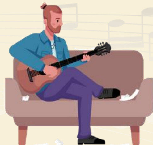
D การซ้อมดนตรี