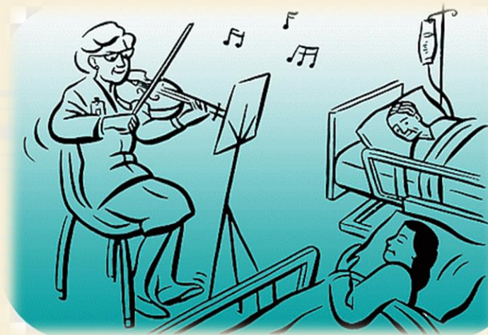
C การเล่นดนตรี ให้ผู้ป่วยฟัง