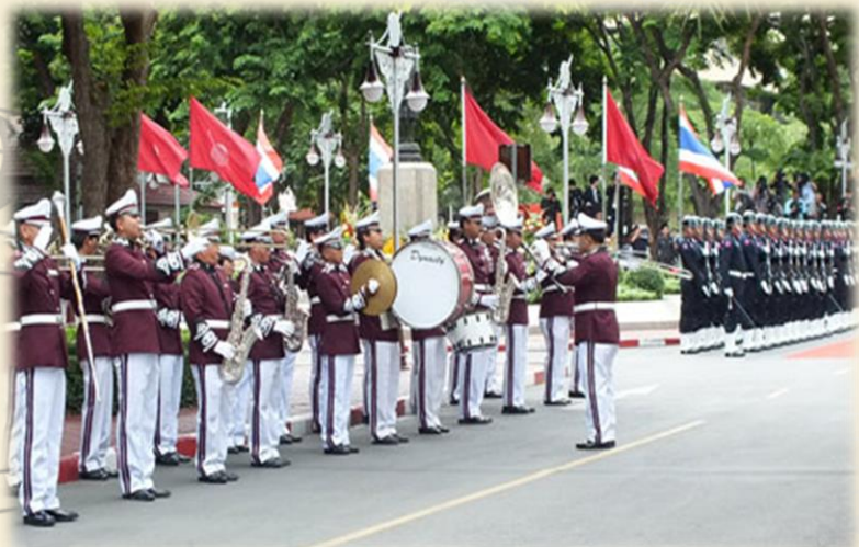
A วงโยธวาทิต บรรเลงเพลงมหาฤกษ์