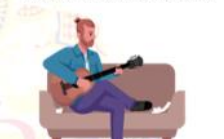
D การซ้อมดนตรี