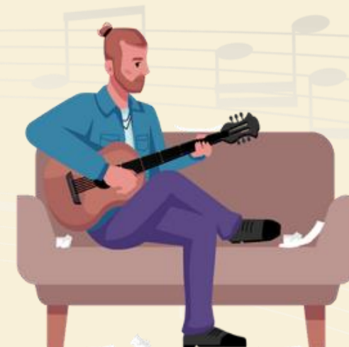
D การซ้อมดนตรี