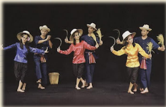
B การแสดงเต้นกำรำเคียว