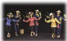
B การแสดงหุ่นงิ้วรำเซียว