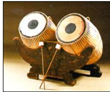
ภาพที่ ๑๖ กลองตะโพน