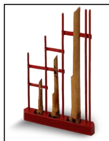
ภาพที่ ๒๑ อังกะลุง

(อินโดนีเซียในปัจจุบัน) และ “ ซิม ” ที่ได้ปรับปรุงจากเครื่องดนตรีจีนที่เรียกว่า “หยางฉิน (Yang Chin)”