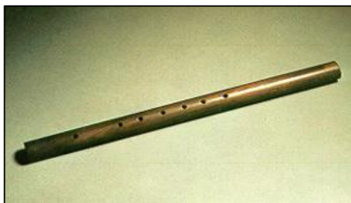
ภาพที่ ๑๗ ขลุ่ยอู้