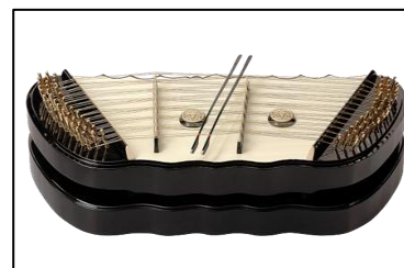
ภาพที่ ๒๒ ซิมสี่สี่