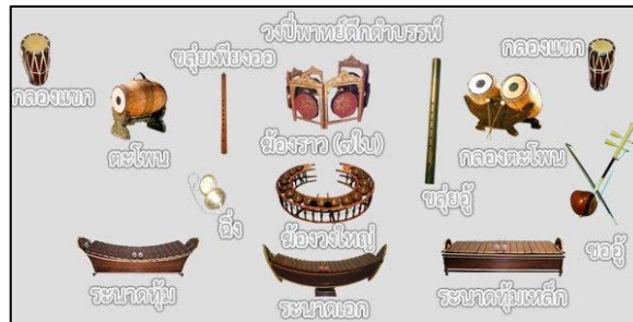
ภาพที่ ๑๙ วงปี่พาทย์ตีกลองค้ำบรรพ์

วงดนตรีไทยในสมัยรัชกาลที่ ๕ ได้เกิดวงปี่พาทย์ไม้นวมชนิดหนึ่งเรียกว่า “.....” ใช้คู่กับละครแบบใหม่ และมีการประชันฝีมือนักดนตรี การประชันนี้เองได้สร้างวิวัฒนาการขึ้นมากมาย ก่อให้เกิดการผสมวงขึ้น โดยการเอาเครื่องดนตรีต่าง ๆ มารวมเพิ่มขึ้นในวง