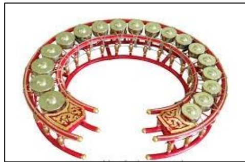
ภาพที่ ๑๐ ฆ้องวงเล็ก