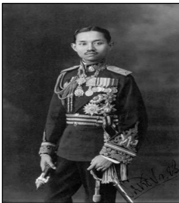
ภาพที่ ๒๔ รัชกาลที่ ๗

ด้านบทเพลงไทยในสมัยรัชกาลที่ ๖ นิยมบรรเลงเพลงประเภท “เพลงเถา” เป็นเพลงไทยที่มีรูปแบบการร้องหรือการบรรเลงติดต่อกันในเพลงเดียว โดยมีอัตราจังหวะลดหลั่นกันตามลำดับไม่น้อยกว่า ๓ ชั้น เป็นต้นว่า สามชั้น (ช้า) สองชั้น (ปานกลาง) และชั้นเดียว (เร็ว)