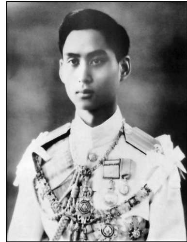
ภาพที่ ๒๕ รัชกาลที่ ๘

พระบาทสมเด็จพระปรเมนทรมหาอานันทมหิดล รัชกาลที่ ๘ (พ.ศ. ๒๔๗๗ - พ.ศ. ๒๔๘๙) ทรงครองราชย์ใน ระยะเวลาไม่นาน ประกอบกับวิกฤตทางการเมืองและเศรษฐกิจ เป็นระยะที่ดนตรีไทยเข้าสู่ภาวะมีดมน รัฐบาลไม่ส่งเสริมดนตรี ไทยแถมยังปลุกฝังวัฒนธรรมตะวันตกให้คนไทย ให้คนไทยหันไป เล่นดนตรีแบบตะวันตก ต่อมารัฐบาลยังได้ออกพระราชกฤษฎีกา เกี่ยวกับการจัดระเบียบวัฒนธรรมทางศิลปกรรม เป็นสาเหตุหนึ่ง ที่ทำให้ให้ครูและนักดนตรีไทยเข้าใจว่ารัฐบาล ห้ามเล่นหรือไม่ ส่งเสริมดนตรีไทย แต่อย่างไรก็ตาม แม้รัฐจะมีได้ห้ามโดย เคร่งครัด คือ ยังอนุญาตให้บรรเลงในงานหรือพิธีบางอย่างได้ แต่ ก็ห้ามนั่งบรรเลงกับพื้น ทั้งยังต้องขออนุญาตจากทางราชการ และต้องมีบัตรนักดนตรีที่ทางราชการออกให้