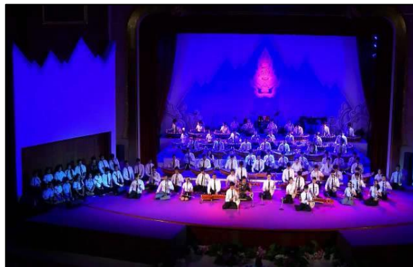
ภาพที่ ๓๑ วงมหาดุริยางค์

และมีการผสมวงดนตรีเฉพาะกาลที่เรียกว่า “วงมหาดุริยางค์” เป็นวงดนตรีไทยที่มีขนาดใหญ่ ประกอบด้วยเครื่องดนตรีทั้ง ๔ ประเภท และมีลักษณะการผสมวงเช่นเดียวกับวงมโหรีแต่ได้เพิ่มเครื่องดนตรีขึ้นจำนวนหลายสิบชิ้น รวมทั้งวงดนตรีไม่น้อยกว่า ๑๐๐ ชิ้น โดยมีผู้บรรเลงฉิ่งเพียงคนเดียวที่ทำหน้าที่กำกับจังหวะอยู่ด้านหน้าวงเหมือนวาทยกร (Conductor) ในวงดุริยางค์สากล (Orchestra)