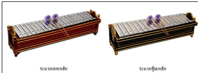
ภาพที่ ๑๒ ระนาดเอกเหล็กและระนาดทุ้มเหล็ก

เครื่องดนตรีไทยในสมัยรัชกาลที่ ๔ มีการสร้างเครื่องดนตรีขึ้นใหม่ให้มีเสียงดังกังวานมากขึ้น โดยทรงใช้หลักการกำเนิดเสียงจากเครื่องเขี่ยหวีเหล็ก (Music Box) มาดัดแปลงเป็น “..... หรือ ระนาดเอกเหล็ก” และ “ระนาดทุ้มเหล็ก” แล้วนำไปผสมในวงดนตรีต่อไป