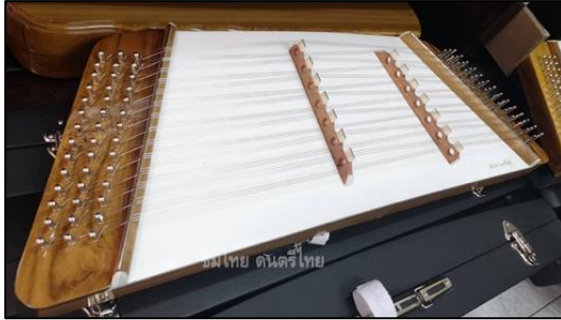
ภาพที่ ๒๙ ขิมคางหมู