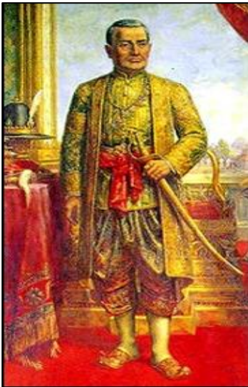
ภาพที่ ๑ รัชกาลที่ ๑

๓) ยุคคลี่คลาย หมายถึง ช่วงแห่งการสืบทอดและอนุรักษ์ศิลปะวิทยาการจากยุครุ่งเรือง รวมถึงการพยายามหารูปแบบความคลาสสิก ด้วยการปรับปรุงตามระเบียบวิธีของไทยเอง และรับการสังสรรค์ทางวัฒนธรรมจากตะวันตก จนเกิดเป็นดนตรีแนวใหม่ ซึ่งตรงกับช่วงรัชกาลที่ ๗ - จนถึงรัชกาลปัจจุบันเป็นระยะเวลา ๘๔ ปีมาแล้ว