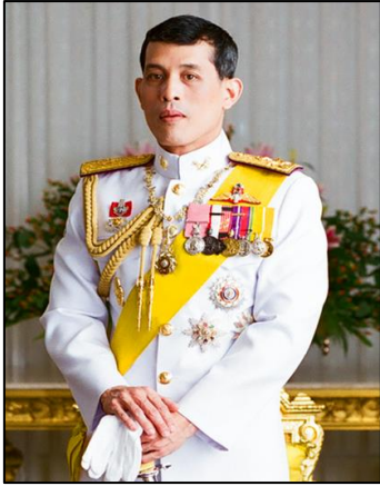
ภาพที่ ๓๒ รัชกาลที่ ๑๐