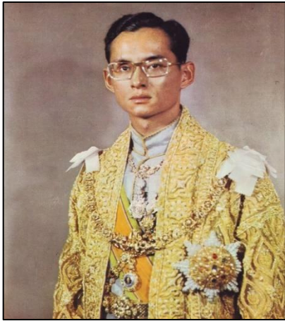
ภาพที่ ๒๗ รัชกาลที่ ๙

พระบาทสมเด็จพระปรมินทรมหาภูมิพลอดุลยเดช รัชกาลที่ ๙ (พ.ศ. ๒๔๘๙ - พ.ศ. ๒๕๕๙) ทรงอุทิศพระองค์เพื่อบำเพ็ญพระราชกรณียกิจที่จะก่อให้เกิดประโยชน์สุขของประชาชนและความเจริญรุ่งเรืองเป็นปึกแผ่นของประเทศชาติเป็นสำคัญ ส่วนในด้านศิลปวัฒนธรรม ทรงมีพระอัจฉริยภาพในด้านศิลปะหลายแขนง โดยเฉพาะด้านดนตรีนั้นทรงโปรดเป็นพิเศษ ขณะทรงศึกษาอยู่ในต่างประเทศ ทรงโปรดเครื่องดนตรีสากลประเภทเครื่องเป่า ภายหลังเมื่อเสร็จครองราชย์ทรงได้พระราชนิพนธ์เพลงต่าง ๆ มากมาย และทรงก็มีความสนใจเกี่ยวกับดนตรีไทยทั้งภาคปฏิบัติและภาคทฤษฎี ทรงฝึกหัดเป่าปี่ใน และทรงริเริ่มให้มีการบรรเลงเพลงไทยที่เรียบเรียงขึ้นจากเพลงไทยสากล โดยให้ครู