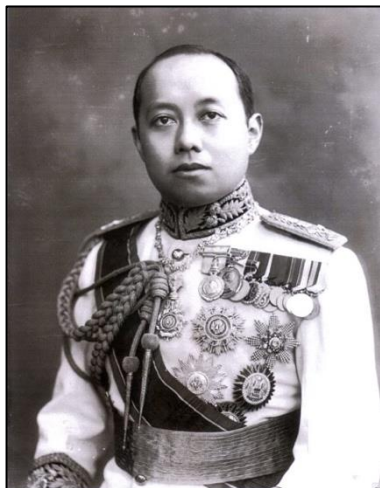
ภาพที่ ๒๐ รัชกาลที่ ๖

บทเพลงในสมัยรัชกาลที่ ๕ ปรากฏเพลงทางกรอขึ้นเป็นครั้งแรก อาทิ เพลงเขมรไทรโยค และมีการนำเพลงหลาย ๆ เพลงที่มีความสอดคล้องทั้งด้านอัตราจังหวะ ทำนองและสำเนียงของเพลงมาเรียงติดต่อกัน เรียกว่า “ต๊บเพลง”