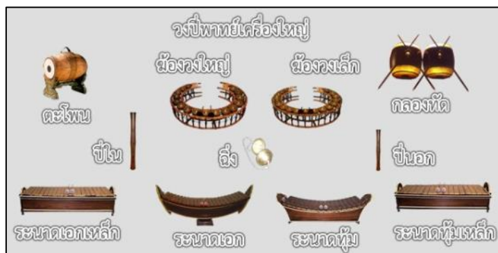
ภาพที่ ๑๓ วงปี่พาทย์เครื่องใหญ่

วงดนตรีไทยในสมัยรัชกาลที่ ๔ เมื่อมีผู้คิดประดิษฐ์เครื่องดนตรี คือ “ระนาดเอกเหล็กและระนาดทุ้มเหล็ก” ได้นำมาประสมในวงปี่พาทย์มีขนาดใหญ่ขึ้น จึงเรียกว่า “.....”