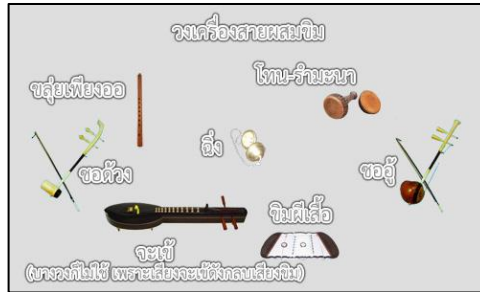
ภาพที่ ๒๓ วงเครื่องสายผสม

วงดนตรีไทยในสมัยรัชกาลที่ ๖ เมื่อมีเครื่องดนตรีต่างชาติเข้ามาในประเทศไทยมากขึ้น จึงได้นำเครื่องดนตรีต่างชาติเข้ามาผสมในวงเครื่องสายของไทย เกิดเป็น “วงเครื่องสายผสม” โดยเรียกชื่อตามแต่เครื่องดนตรีที่นำมาผสมด้วย เช่น วงเครื่องสายผสมเปียโน วงเครื่องสายผสมออร์แกน วงเครื่องสายผสมซิม เป็นต้น