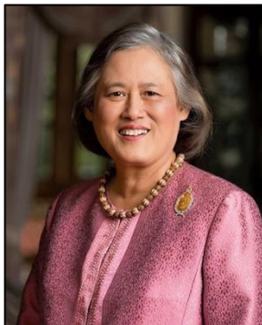
ภาพที่ ๒๘ สมเด็จพระกนิษฐาธิราชเจ้า กรมสมเด็จพระเทพรัตนราชสุดาฯ สยามบรมราชกุมารี

ในขณะเดียวกันสมเด็จพระกนิษฐาธิราชเจ้า กรมสมเด็จพระเทพรัตนราชสุดาฯ สยามบรมราชกุมารี ทรงโปรดดนตรีไทยมาก ทรงอุปถัมภ์และทำนุบำรุงดนตรีไทยตลอดมา ทรงพระราชทานถ้วยรางวัลแก่นักเรียนหรือวงดนตรีไทยที่ชนะเลิศในการประกวดต่าง ๆ ทรงเป็นประธานในการแสดงดนตรีไทย รวมถึงทรงร่วมบรรเลงดนตรีในโอกาสต่าง ๆ