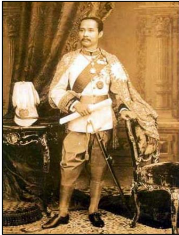
ภาพที่ ๑๔ รัชกาลที่ ๔

บทเพลงไทยในสมัยรัชกาลที่ ๔ เริ่มนิยมแต่งเพลงประเภททยอย และเพลงสามชั้นกันอย่างแพร่หลาย นับเป็นความก้าวหน้าใหม่ในวงการดนตรีไทย นอกจากนี้ครุมีแขกยังได้คิดแต่งเพลงเดี่ยวคือ “เพลงทยอยเดี่ยว” ขึ้นจากเพลงทยอยใน เพื่อใช้เป็นเพลงสำหรับเดี่ยวปีเพื่อบวดยี่ม่อเฉพาะตัว จึงเริ่มนิยมแต่งเพลงเดี่ยวกันเพิ่มขึ้นเป็นลำดับ