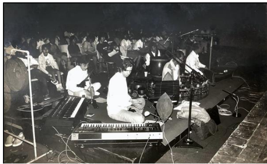
ภาพที่ ๓๐ วงฟองน้ำ

ด้านวงดนตรีไทยมีการนำวงดนตรีไทยและวงดนตรีสากลมาบรรเลงเพลงไทยแนวใหม่ร่วมกัน เรียกว่า “วงดนตรีร่วมสมัย” ซึ่งวงดนตรีร่วมสมัยรุ่นแรก ๆ ในวงการดนตรีไทย คือ “วงฟองน้ำ”