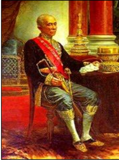
ภาพที่ ๑๑ รัชกาลที่ ๔