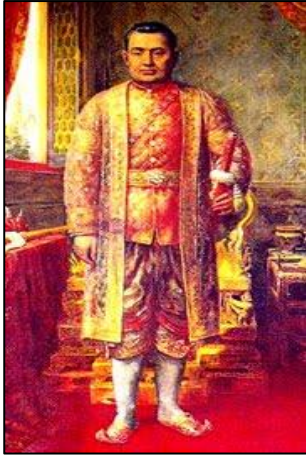
ภาพที่ ๘ รัชกาลที่ ๓