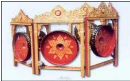
ภาพที่ ๑๕ ฆ้องหุ่ย ๗ ใบ

ด้านเครื่องดนตรีไทยในสมัยรัชกาลที่ ๕ มีการประสมวง ปีพาทย์ขึ้น โดยการปรับปรุงเครื่องดนตรีชนิดใหม่เข้าประสมกัน คือ นำฆ้องหุ่ยหรือฆ้องชัย ๗ ใบ มาเทียบเสียงเรียงกัน ๗ เสียง แล้วทำที่แขวนเรียงรอบตัวผู้ตี เรียกว่า “.....” และ ทรงนำตะโพนไทย ๒ ลูก ถอดเท้าออก แล้วตั้งขึ้นตี เสียงทุ้มต่ำ เรียกว่า “กลองตะโพน” อีกอย่างหนึ่ง มีผู้คิดประดิษฐ์ขลุ่ยขนาดใหญ่ที่มีเสียงทุ้มต่ำเรียกว่า “ขลุ่ยอู้” ขึ้น