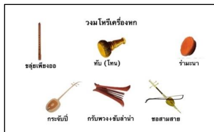
ภาพที่ ๗ วงมโหรีเครื่องหก

วงมโหรีเครื่องหก ประกอบด้วย กระจับปี่ ซอสามสาย และขลุ่ยเพียงออเป็นเครื่องดำเนินทำนอง ส่วน ฉิ่ง โทน และรำมะนานั้น เป็นเครื่องกำกับจังหวะในวง