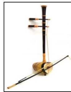
ภาพที่ ๔ ซออู้