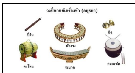
ภาพที่ ๘ วงปี่พาทย์เครื่องห้าในสมัยอยุธยา

๓. .... เป็นวงดนตรีที่มีรากฐานมาจากวงปี่พาทย์เครื่องห้าในสมัยสุโขทัย สันนิษฐานว่า เมื่อมีผู้คิดค้น “ระนาด” ขึ้น จึงได้นำมาผสมในวงให้เกิดความสมบูรณ์และไพเราะยิ่งขึ้นกว่าเดิม แต่ยังคงเรียกปี่พาทย์เครื่องห้า (ไม่นับรวมฉิ่ง) ซึ่งประกอบด้วย ปี่ใน ๑ เลา ระนาด ๑ ราง ฆ้องวง ๑ วง ตะโพน ๑ ใบ และกลองทัด ๑ ลูก หน้าที่ของวงปี่พาทย์เครื่องห้า นั้น ยังคงใช้สำหรับการประโคม และบรรเลงประกอบการแสดงโขนละครเช่นเดิม