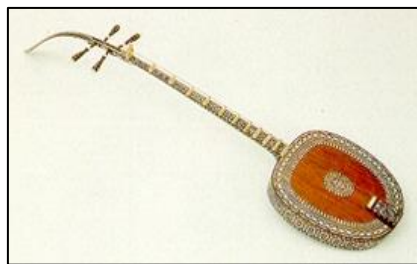
ภาพที่ ๖ กระจับปี่

ติดกระจับปี่ หมายถึง พิณชนิดหนึ่ง ที่มีมาตั้งแต่สมัยสุโขทัย มี ๔ สาย เหตุที่เรียกเครื่องดนตรีนี้ว่า กระจับปี่ เพราะเพี้ยนมาจากคำว่า “กัจฉปี่” ซึ่งเป็นภาษาชวา และเพี้ยนมาอีกต่อหนึ่งจากคำว่า “กัจฉปะ” เป็นภาษาบาลีแปลว่า “เต่า”