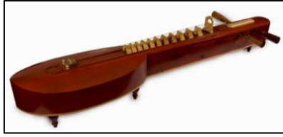
ภาพที่ ๕ จะเข้