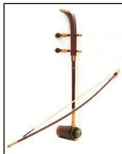
ภาพที่ ๓ ซอด้วง

สีซอ หมายถึง การบรรเลงซอ คำว่า “ซอ” ที่ระบุไว้ในกฎหมายตราสามดวงนี้ คงเป็นซอด้วงและซออู้ เพราะหากพิจารณาตามสภาพการณ์ในสมัยนั้น ซึ่งเล่นดนตรีกันอย่างสนุกสนานและแพร่หลาย จนต้องบัญญัติไว้เป็นกฎหมายห้ามกันอย่างนี้ ย่อมเป็นเครื่องดนตรีที่เล่นได้ไม่ยาก สามารถหาได้ง่ายและพกพาสะดวก จึงสันนิษฐานว่า “ซอ” ที่ระบุไว้ หมายถึง ซอด้วงและซออู้ แต่ที่บัญญัติว่า “ซอ” เท่านั้น คงเพื่อให้ครอบคลุมถึงซอสามสายและซออื่น ๆ